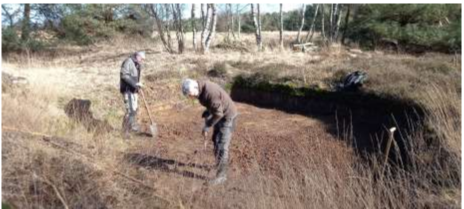
De insecten worden wel verwend met zo'n mooi zandbedje

Komend jaar ligt de kuil er weer spiegelglad bij. Klaar voor de insecten.