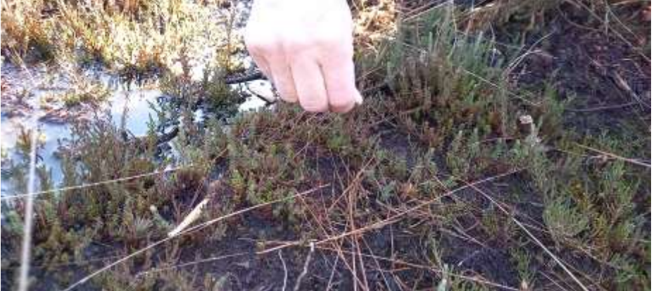
Laag zaaien is nodig om verwaaiing te voorkomen.