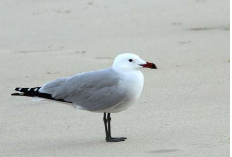
Andouins meeuw

Het tijverschil kan afhankelijk van de morfologie van de kuststrook wel 3-4 meter bedragen. Mijn interesse ging daarom dit jaar (ik ga volgend jaar weer!) vooral uit naar de winter-avifauna van deze vogelrijke wetlands. Die bestaat voor een deel uit standvogels, zoals diverse reigersoorten, Zwarte ibis en Lepelaar, voorts Dodaars en eenden zoals Bergeend, Krooneend, Pijlstaart, Slobeend, Krakeend, Wintertaling en Smient. Daarnaast natuurlijk veel steltlopers, zoals Bonte en Drieteenstrandloper, Strand- en Bontbekplevier, Zilverplevier, Steenloper en vooral ook veel Steltkluten. Daarnaast werden al veel pleisterende en naar Noord-Atlantische wetlands doortrekkende steltlopers als Grutto, Tureluur, Wulp, Regenwulp, Groenpoten, Scholeksters en Kieviten gezien. De Iberische meeuwenbevolking verschilt duidelijk van die van de Noord-Atlantische regio. Zo is de zeer algemene Geelpootmeeuw de plaatsvervanger van de Zilvermeeuw bij ons. Ook zag ik Adouins- en Dunbekmeeuwen. Qua roofvogels viel het een beetje tegen. Een enkele Bruine kiekendief en Visarend gezien. Van de laatste soort broeden er volgens de vogelgids vorig jaar 38 paartjes in de Ria Formosa!