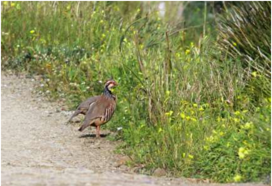
Rode patrijs

De randen van de wetlands worden gevormd door grazige heuvels met extensief agrarisch gebruik, veel boomweiden die soms niet meer werden begraasd en dan met divers struweel verruigen. Hèt biotoop voor de Hop, Blauwe ekster en Rode patrijs. In de Dongelanden proberen we met gerichte beheer- en inrichtingsmaatregelen de gewone Patrijs terug te krijgen. In de Algarve komt deze niet voor, maar zijn rode soortgenoot is op de boomweiden regelmatig te horen en op zandweggetjes te spotten, soms ook als verkeersslachtoffer. Het was jammer genoeg te vroeg voor de Kuifkoekoek, Bijeneter, Scharrelaar en Grauwe kiekendief. Toch heb ik in die twee wintermanden bij elkaar ruim honderd verschillende soorten vogels waargenomen.