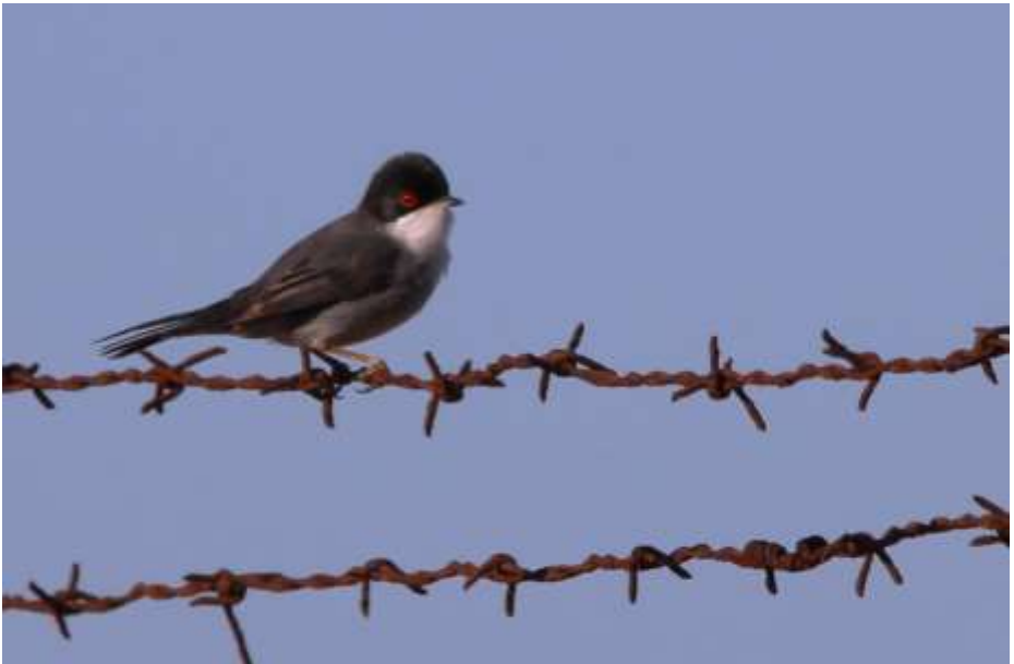
Kleine zwartkop

Buiten de invloed van de zee liggen er overal poelen en moerasjes. Veel moerasvogels waren nog niet terug uit Afrika, maar de Cetti's zanger is ter plaatse een standvogel en liet zich overal horen. Ook het Sint Helena's fazantje had in het riet zijn nestje al klaar. Dat is een 'vliërevogeltje' uit de familie van de prachtvinken: grijsbruin gestreepte borst en rood maskertje. Exotisch, want van nature inheems in Afrika. De soort kan zich vanwege het klimaat handhaven aan de zuidkust van Portugal en Spanje. Een topper was het op twee locaties waarnemen van de Purperkoet, een groot, maar erg schuw familielid van onze Meerkoet en Waterhoen, die overigens beide ook in de Algarve aanwezig zijn. De Waterral werd meerdere keren gehoord.