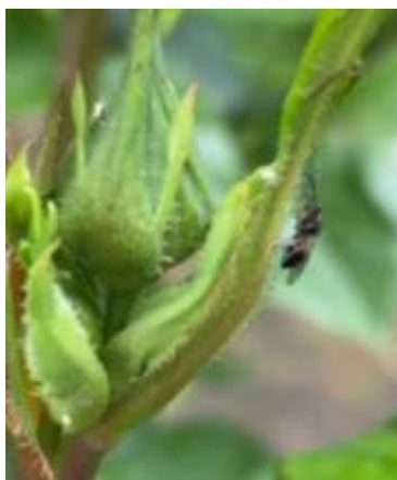
Still uit het filmpje (kwaliteit is beperkt)