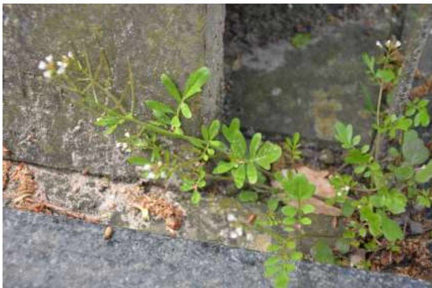
Aziatische veldkers

Als snel groeien uit die witte bloempjes lange vruchtjes. In verhouding tot het bloemetje is het een forse hauw tot wel 2,5 centimeter lengte.