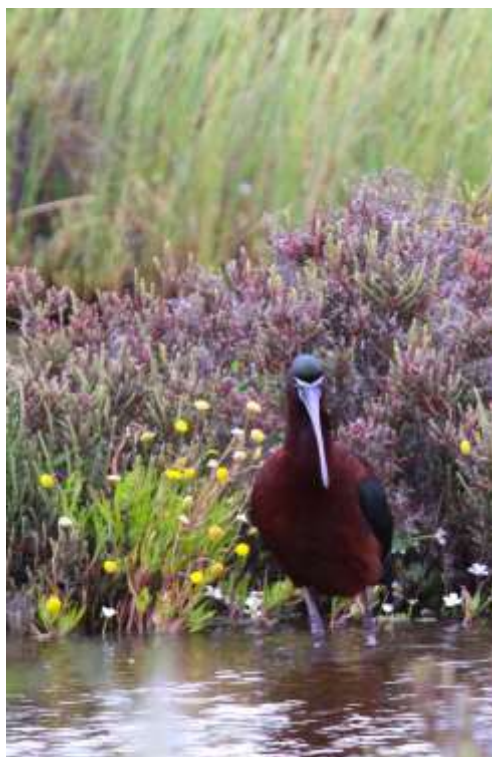
Zwarte ibis