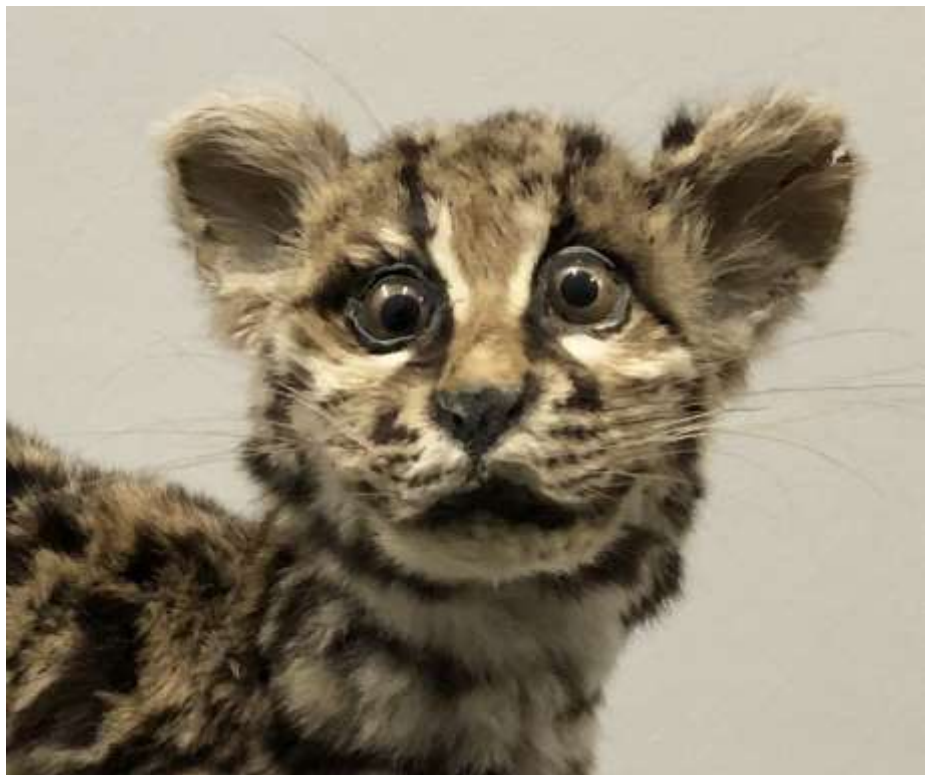
De schele Boomkat

De zaal wordt een wisselzaal, die afwisselend wordt gebruikt voor Van Potlood tot Pixel en Comedy Wildlife .