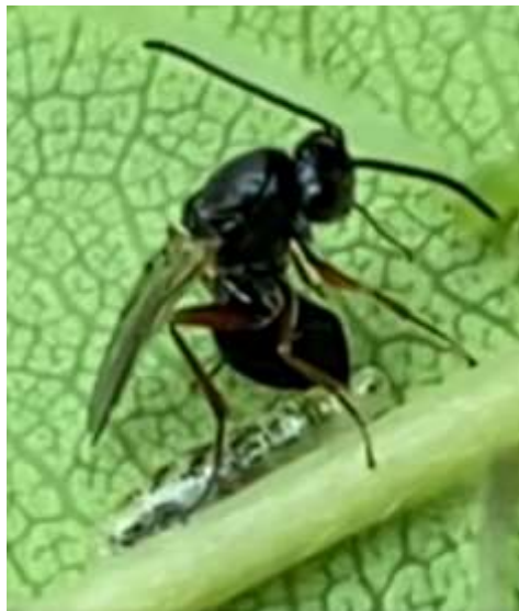
Still uit het filmpje van de eiafzet (kwaliteit is beperkt)

In dit laatste deel van het filmpje zien we de wesp gekromd staan, nu boven de kopzijde van de zweefvlieglarve. Waarschijnlijk is dit haar eileghouding en vindt ovipositie plaats. Ovipositie betekent hier dat een vrouwtje haar legboor in een gastheer steekt om een ei te leggen. Door het inzoomen op de wesp is de scherpte een tijd uit het beeld maar daarna zien we weer de gestrekte antennen. De eileg wordt snel afgebroken en we zien de wesp daarna meteen weglopen. Ik heb de wesp daarna snel gevangen en mee naar huis genomen om haar op naam te kunnen brengen. Ook het blad met de zweefvlieglarve werd voorzichtig mee naar huis genomen om verder op te kweken met bladluizen van de rozen. Op dezelfde rozenstruik werd nog een tweede larve gevonden en meegenomen voor kweek. De kweek van de zweefvlieglarven mislukte helaas.