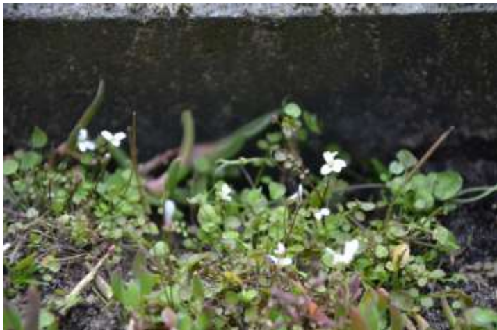
Nieuw-Zeelandse veldkers