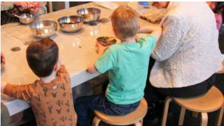
Meivakantie activiteiten : Zaaibommen maken

Tussen de Nationale Bijentelling (15-24 april) en de week van de biodiversiteit (18 t/m 26 mei) staat Natuurmuseum Brabant bol van de activiteiten rondom bestuivers. Het doel is om zoveel mogelijk mensen te verwonderen met biodiversiteit, en ze hier kennis over laten opdoen- met een focus op bestuivers in de breedste zin van het woord. Het precieze programma is nog niet bekend. Zodra er meer duidelijk is wordt het bekend gemaakt op natuurmuseumbrabant.nl . Wel bekend is de datum van de wespenlezing: op 21 mei door Wim Klein en Theo Peeters. 2024 is het 'Jaar van de wesp'. Wim en Theo geven een inleiding op de grote verscheidenheid aan wespen. Aan de orde komen de herkenning van wespen en hun diversiteit in Nederland. Verschillende wespenfamilies komen langs en ze bespreken de evolutie van de wespen. Tevens zoomen zij in op de levenswijzen van enkele soorten of groepen. Na deze lezing heb je een beter idee van de boeiende wereld van wespen en keer je met een gerust hart huiswaarts! Mocht je een probleemwesp hebben, dan mag je die gerust meenemen.