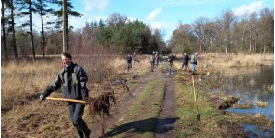
Rechts is de berm zoveel mogelijk opgeschoond, links blijven nog wat wilgen staan