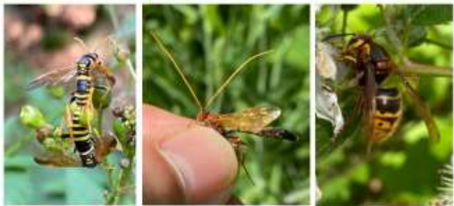
Wim Klein & Theo Peeters Natuurmuseum Brabant, 21 mei 2024, 20.00 u