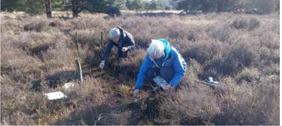
Het lijkt wel op 'synchroon zaaien'!

Nu de natuur ontwaakt waren we benieuwd of het eerder uitgezaaide zaad van Klokjesgentiaan al ontkiemd was. Jammer genoeg was er op de erg natte zaaiplaats nog niets van nieuwe plantjes te zien. Sowieso was het lastig om de zaaiplaatsen te lokaliseren in het natte gebied. Nieuwe ronde, nieuwe kansen .... dus werd nieuw Klokjesgentiaanzaad uitgestrooid.