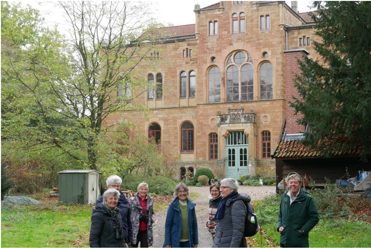
Kasteel nieuw Barenaue