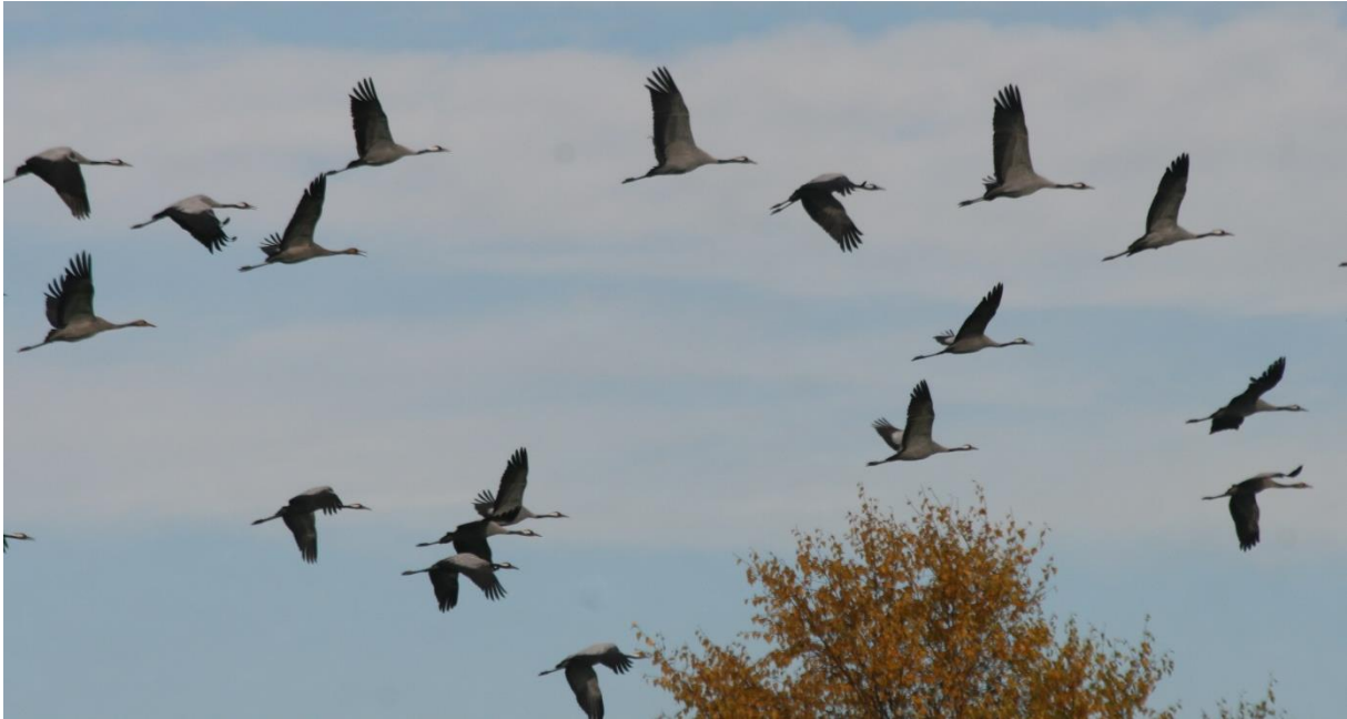
Kraanvogels in de Diepholzer Moor Niederung. (DHM) 2022

Sedert 2011 hebben leden van de Vogelwerkgroep van de KNNV Afd. Tilburg, met uitzondering in de Corona periode, jaarlijks de hoogveengebieden rondom Diepholz bezocht.