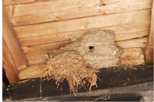
Nest van huiswaluw bovenop het nest van een boerenwaluw

Na het ontbijt en het opruimen gaan we naar huis. Maar niet voordat we op de prachtige lindenlaan van Alt Barenaue hebben gelopen. Ergens mist een bakstenen muur een steen. En daar heeft de winterkoning een prachtig nest gebouwd. Poëzie is overal.