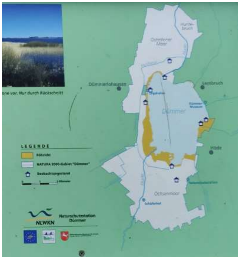
Natura 2000 gebied Dümmer

Een fietstocht langs de Dümmer See staat op het middagprogramma. Bij de plaatselijk fietswinkel in Lembruch halen we een fiets op maat en gaan we op pad. Het oever van de Dümmer See maken onderdeel uit van het Dümmer Natura 2000 gebied. Een bijna 3.000 ha. groot gebied met langs de oevers veel riet en in voorjaar en zomer veel rietzangers; zie kaart en https://natura2000.diepholz.de/schutzgebiete/steckbriefe-aller-ffh-gebiete/duemmer/ De waterstand van het meer is een stuk lager dan het jaar ervoor. Het water van de beek de Hunte stroomt het meer in en er ook weer uit. Hoe wordt de waterstand van het meer geregeld. Door middel van sluisjes en stuwen?