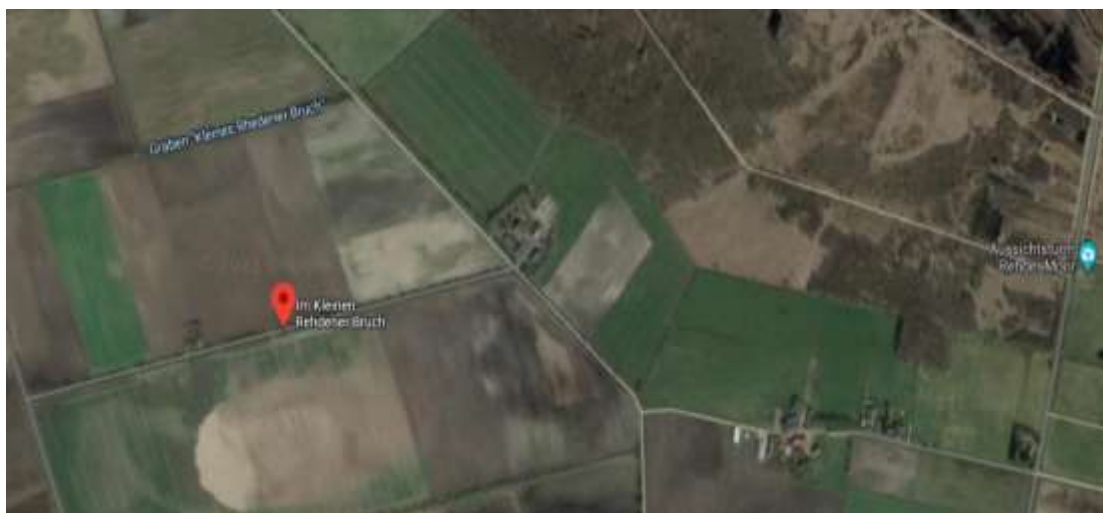
Uitkijkpunt Kraanvogels: Im Kleinen Rhedener Bruch, Rheden, naast de boerderij

Om 7 uur vertrekken we naar Rhedener Geestmoor. Om precies te zijn naar Im Kleinen Rhedener Bruch, Rheden naast een boerderij, zie het kaartje. Een half uurtje is wat kort om op te staan en met verrekijker in de aanslag in de bus te zitten, maar het lukt net. Gelukkig is het niet ver rijden en zijn we op tijd om de kraanvogels die in het eerste ochtendgloren vertrekken, goed te zien.