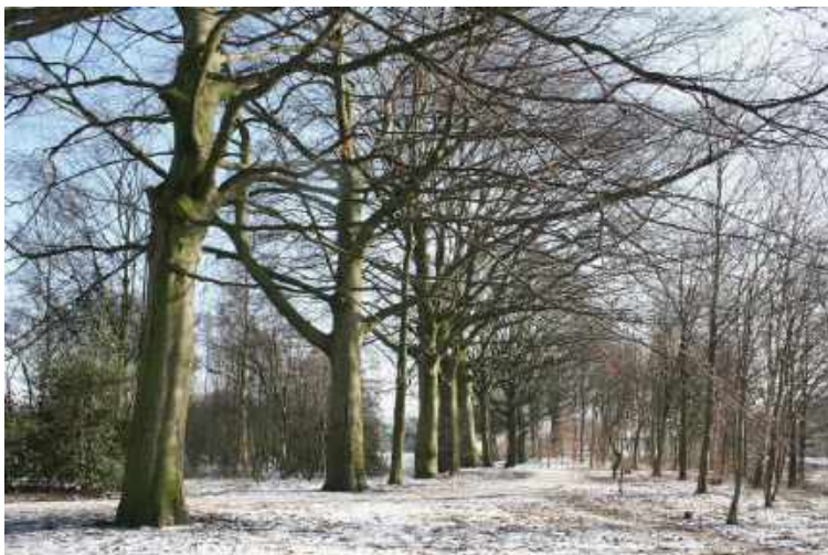
Oude beuken & eiken locatie Steenfabriek Claessens & Co- Centaurusweg

Een belangrijke verbindingsweg met onder andere de herdgang de Heikant was de Nieuw-Lovenstraat. In de 18 e eeuw liep deze vanaf de Heikantse baan, door de bossen van de Rauwbraken, zuidwaarts tot de Oisterwijksebaan. Het zuidelijke deel van de Nieuw-Lovenstraat verdween in de 20 e eeuw. Ook het noordelijk deel verdween door alle nieuwe elementen in het gebied. Een deel van het huidige Joplinpad volgt de oude lijn van de Nieuw-Lovenstraat, inclusief de vele zomereiken (1950) die nog langs deze smalle weg staan. Een sfeervol groen deel ligt in een bocht van het Joplinpad, tegen de Centaurusweg aan. Op de plek waar het Café de Kluit stond, staan tientallen oude lindes en meerdere flinke eiken en beuken (1920-1930) van een behoorlijke leeftijd. Een groene oase tussen industrie en huizen. Aan de zuidzijde van de haven van Industrieterrein-Oost loopt de oude lijn door via de Nautilusstraat. Aan de grens van de voormalige herdgang Loven, tussen de vijver aan de Centaurusweg en het Wilhelminakanaal, staan enkele oude eiken en beuken. Ze werden nog voor de bouw van de steenfabriek van Claesen & Co, aangeplant in 1900. Deze bomen staan vanaf de Heikantsebaan langs de weg er naar toe. Een vijftal Canadese populieren (1930) in dezelfde rij dateren ook uit de tijd van de Rauwbraken. Waardevolle natuurlijke herinneringen.