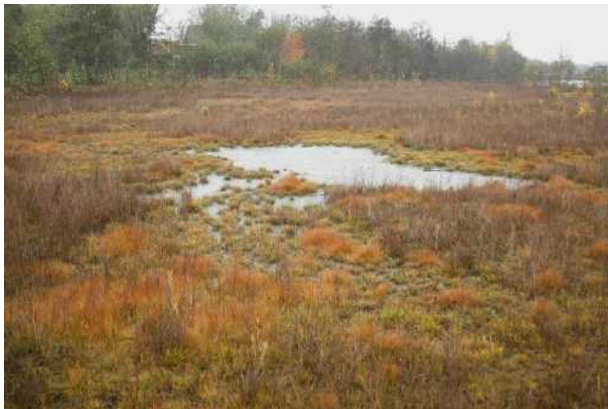
Vooraf het zuidelijke deel was in de eerste jaren van de tellingen nog heel open

In de, door de gemeente Tilburg en Heidemij Advies in 1996, uitgegeven brochure met de ondertitel 'Een ecologische verbindingszone door de woonwijk Reeshof', wordt de aanduiding Dongezone voor het gebied gebruikt. Ook in eerder verschenen plannen en visies sprak men van de Dongezone. Later is de benaming Dongevallei algemeen geworden. In het begin van de 90er jaren van de 20 e eeuw zijn op verschillende niveaus definitieve plannen gemaakt voor de gebieden ten westen van Tilburg, inclusief de daar stromende beek de Oude Ley/Donge. Van het oorspronkelijke plan om dit gebied deel te laten uitmaken van de ecologische hoofdstructuur van Nederland stapte men af. In het provinciaal beleid werd de Oude Ley/Donge aangegeven als verbindingszone tussen de natuurkerngebieden Regte Heide/Riels Laag en de Lange Rekken. Om dit invulling te geven nam het Waterschap de Dongestroom deze aanbeveling op in 'Het Natuurproject Oude Ley/Donge' dat betrekking heeft op het tracé tussen de Goorstraat -op het Landgoed Ooievaarsnest- en het Wilhelminakanaal. Langs dit tracé zijn verschillende projecten uitgevoerd om de landschappelijke en ecologische waarden van het beekdal te vergroten.