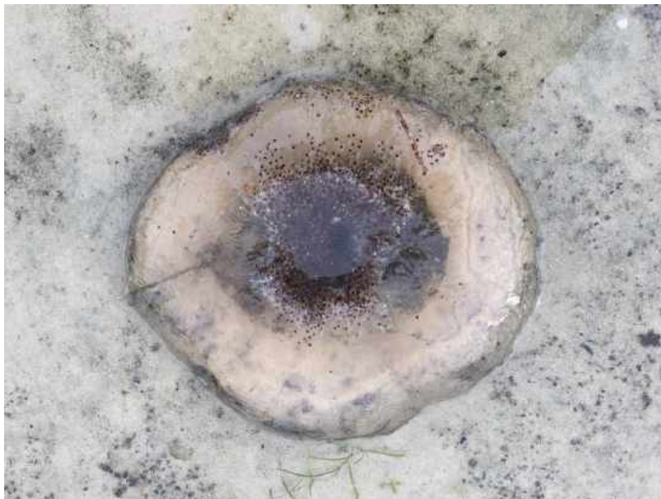
Kwal op oever Galgeven

Er kwam ook een nieuwe vraag binnen van Job van den Hoven. Hij houdt zich veel bezig met uilen, maar heeft ook zelf een scherpe blik. Hij zag eind oktober/begin november in het Galgeven heel veel geleachtige klompjes. Toen hij er beter naar keek, leken het allemaal kwallen. Er lagen er wel 100 tot 150 op de oever van het ven. De kleintjes waren drie centimeter in doorsnee en de grote wel 12 centimeter. De klompen waren ongeveer anderhalve centimeter dik. Wie herkent dit verschijnsel? Zijn het werkelijk kwallen en wat doen die in zo'n vrij zuur ven? Of heeft de gelei een heel andere herkomst. We zijn heel benieuwd.