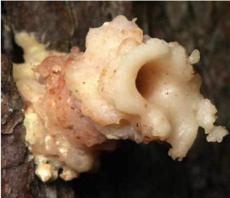
Harsbuisjes op dennen bij Dwingelderveld

Arie liep dit jaar mee met de paddenstoelenwerkgroep in de Kaaistoep. Om zich goed voor te bereiden op zijn bezoek aan Tilburg bezocht hij de website van onze afdeling. Daar ontdekte hij de rubriek 'Witte gij ut?'. Hij kon het niet laten om te reageren en vroeg zich af of dat als buitenstaander wel mocht. Ik heb hem meteen verteld dat we juist heel blij zijn met zijn inbreng. Hij denkt namelijk dat de harsbuisjes zijn veroorzaakt door het uitkruipen van de Grijsje ribbelboktor. De larven leven in het dennenhout, maar moeten een keer als kever de stam verlaten. Hij zag bij het Dwingelderveld enkele exemplaren van deze keversoort op een dennenstronk, waarop ook nog vers uitziende harsbuisjes zaten. De mooie foto, die hij van de harsbuisjes heeft gemaakt, is hieronder te bewonderen.