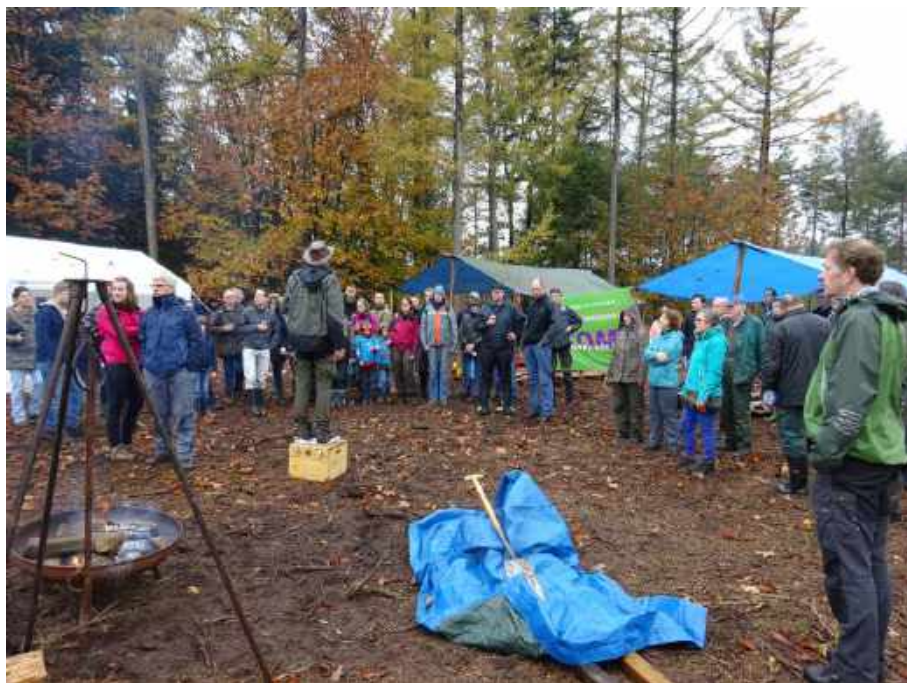
De tenten gezet, het kampvuur is aan, een korte introductie en dan aan de slag

Ondanks dat het altijd een race tegen de klok is om alles op tijd klaar te hebben voor de ontvangst van de deelnemers, nemen we even de tijd om van dit mooie moment te genieten. Zo, dat is een goed begin van de dag. Maar dan snel aan de slag. We moeten routepijlen aanbrengen, tenten bouwen, vlaggen en banners ophangen, info tafels inrichten, kampvuur maken, werkplekken inspecteren, koffie zetten, parkeren begeleiden, AED ophangen, enzovoort. Maar met de hulp van de leden van de plaggroep komt het iedere keer weer op tijd klaar. Het is alweer voor de 16 e keer dat we de tenten hebben opgezet voor de Natuurwerkdag. Dit keer zijn we weer op de Regte Heide neergestreken.