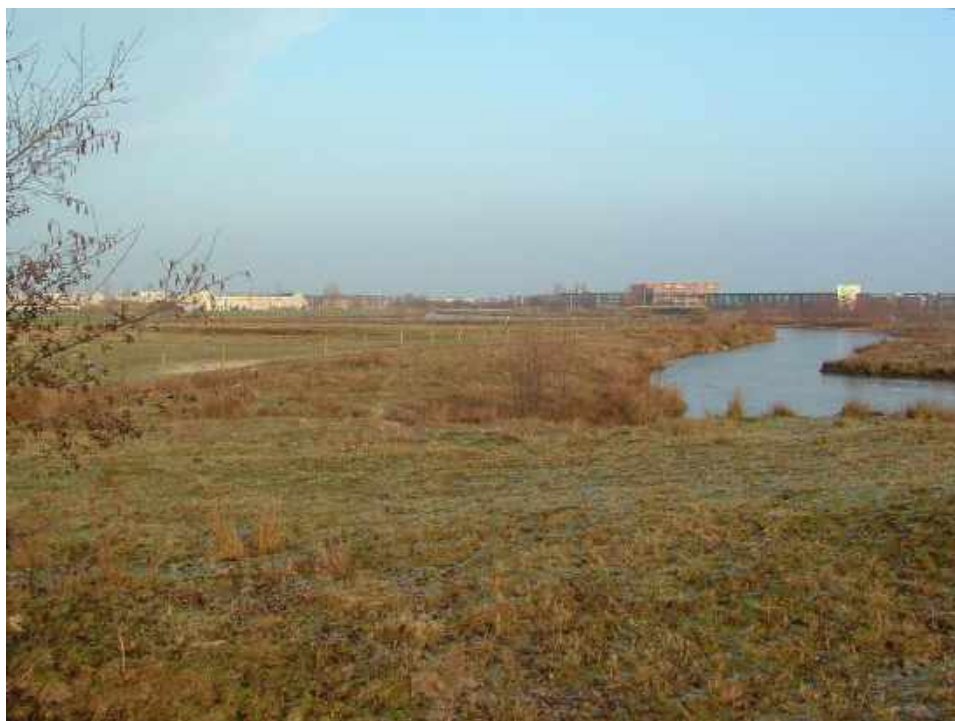
Er zijn meerdere poelen gegraven en permanente laagtes aangelegd

Van 1996 tot 2000 is de Dongevallei tussen de spoorlijn Tilburg-Breda en het Wilhelminakanaal aangelegd. Het meest noordelijke deel ging het eerst op de schop. Aan beide zijden van de 'genormaliseerde' en verplaatste beek is van een strook van ongeveer 75 meter de overbemeste bovenste laag afgegraven. Dat is voorzichtig gedaan om de onderliggende bodemstructuur intact te laten. De loop van de beek is meanderend gemaakt en plaatselijk verlegd en opgesplitst om een groot eiland te creëren. Er zijn meerdere poelen van uiteenlopend formaat gegraven en permanente laagtes aangelegd. Aanvankelijk beseffen de meeste bewoners niet dat de zandvlaktes een natuurgebied in wording zijn. Al snel bezetten pioniersgrassen, -planten, mossen en ook vogels het zand.