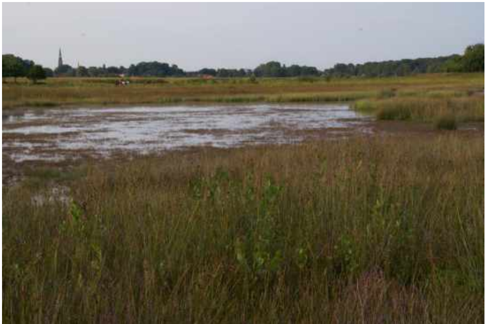
Tijdens de Wandeldrieluik wordt o.a. de Regte Heide bezocht

Na aanmelding ontvangen de deelnemers de definitieve vertrekplaatsen.