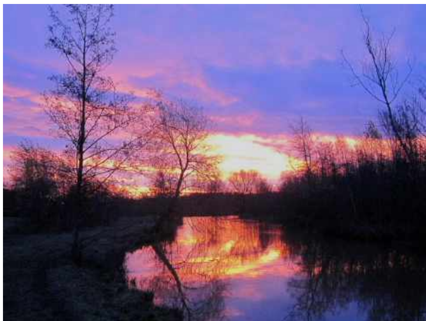
Er werd er in de vroege ochtenduren geteld, in een prachtige omgeving

In de Dongevallei zijn, evenals in het Noorderbos en het Quirijnstokpark, per maand twee tellingen uitgevoerd via een vaste route. Op enkele uitzonderingen na werd er in de vroege ochtenduren geteld.