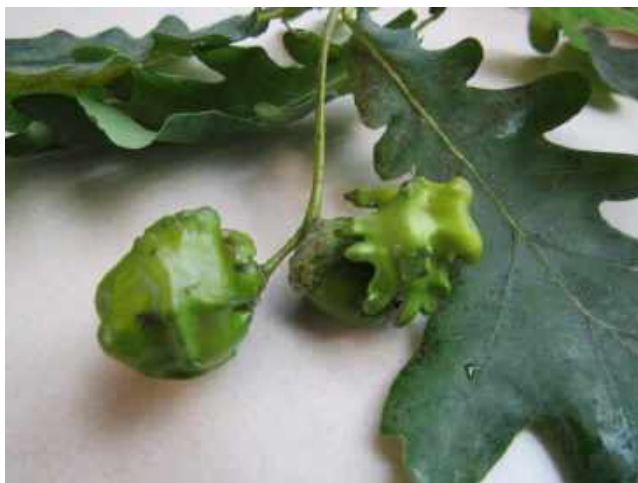
Vreemde eikels