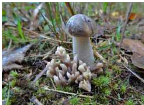
Typische herfstbeelden: links uitbottende Vliegenschwammen en rechts een Berkenboleet met er naast de Asgroeue koraalzwam