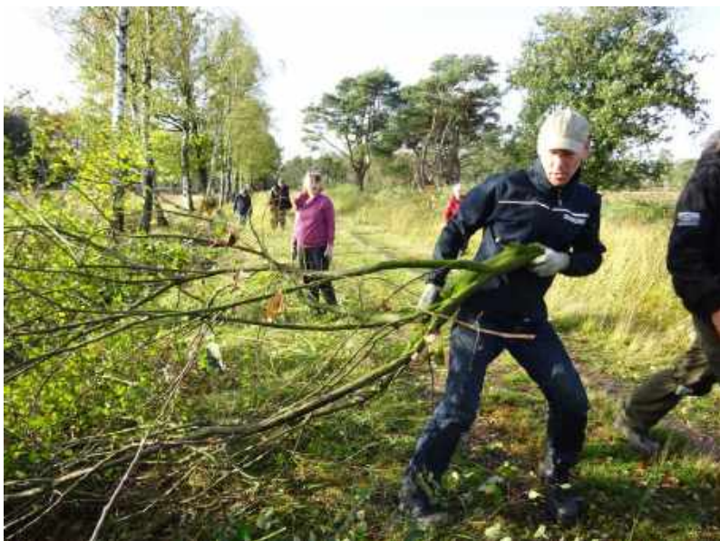
Rechts de open heide en links de akker, midden harde werkers

Op het plan staat vandaag het snoeien van akkerranden en bosranden. We zitten op de grens van de open heide en de voormalige gemeentebossen van Goirle. Brabants landschap wil de overgang van de open heide naar de bossen wat vloeiender maken. Daarvoor zijn al bomen verwijderd en is een corridor gemaakt van de open heide naar 'de Halve maan'. De akkertjes in het terrein zijn zeer waardevol voor de biodiversiteit. De bodem wordt verrijkt met organisch materiaal van de heide. Hiervan profiteert het bodemleven en in de kringloop daarvan ook de knaagdieren, roofvogels en roofdieren. In het voorjaar wordt de akker ingezaaid met een bloemenmengsel of graan. Dit is een mooie basis voor insecten, vlinders, vogels en reeën. De akkerranden en bosranden groeien langzaam maar zeker dicht. Om dit te voorkomen gaan we deze snoeien.