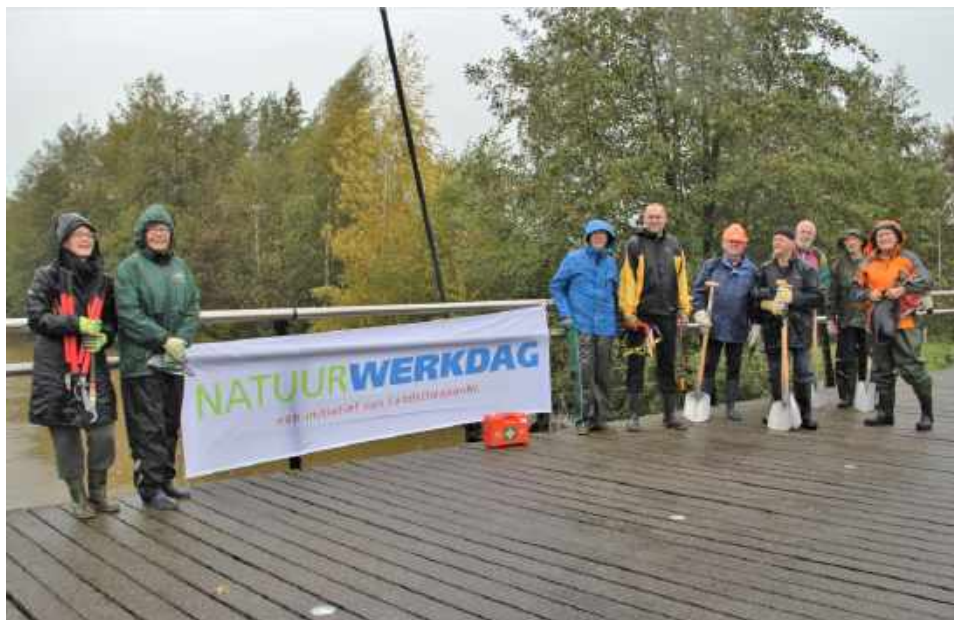
Ondanks de regen begonnen op de landelijke Natuurwerkdag 11 personen welgemoed aan de onderhoudsklus

Ook dit jaar heeft de Vrijwilligersgroep Dongevallei weer meegedaan aan de Landelijk Natuurwerkdag. Op 2 november jl. stonden elf deelnemers op de afgesproken plek. De klus die geklaard moest worden bestond uit het onderhoud en herstel van vijf IJsvogelwandjes in het natuurterrein de Dongevallei in de Reeshof. Van te voren was een Plan van Aanpak gemaakt. Conform de Arbo-instructies en aanbevelingen vanuit het Coördinatiepunt Landschapsbeheer maakte een risico-analyse daar onderdeel van uit (o.a. bereikbaarheid hulpdiensten, melding bij wijkagent cq. handhavingsteam, adequaat gereedschap, inventarisatie van gevaren tijdens werkzaamheden, verstrekking persoonlijke beschermingsmiddelen (pmb's), aanwezigheid EHBO-koffer en mobiele telefoons).