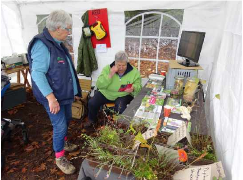
De info tent met fotopresentatie, flora en fauna uit het gebied