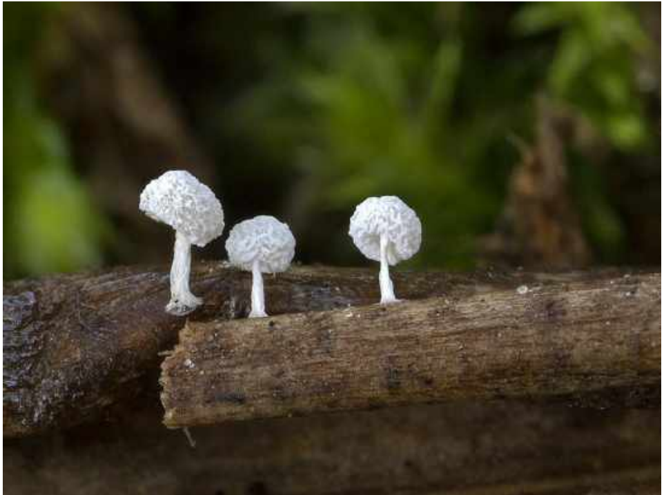
Het Variabel kristalkopje

De aanwezigheid van grote grazers blijkt ook uit het soortenspectrum van de paddenstoelen. Er zijn nogal wat mestindicatoren. Nu zijn die runderen ook zelf goed te spotten, dus daar hebben we de paddenstoelen niet voor nodig. Maar het is toch aardig dat die zogenaamde coprofiele (mestbewonende) soorten substantieel bijdragen aan de totale soortenrijkdom aan fungi. Dit jaar werden bijvoorbeeld voor het eerst het Mestborstelbekertje en het Mestplooirokje, beide minder algemene soorten in Nederland, aangetroffen. Er werd vanzelfsprekend weer druk gefotografeerd. Vooral toen er een aantal witte 'minipietertjes' werden aangetroffen op enkele afgevalen twijgjes. Het betrof een myxomyceet (slijmzwam): 't Variabel kristalkopje ( Didymium squamulosum ), dat overigens eigenlijk niet tot de echte schimmels wordt gerekend. De soort is niet zeldzaam, maar omdat het zo klein is (1-1½ mm hoog) wordt het vaak over het hoofd gezien. Bart heeft er natuurlijk weer een mooie plaat van gemaakt.