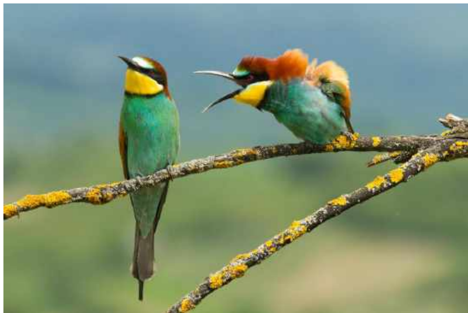
Eén van de foto's uit de tentoonstelling Comedy Wildlife Awards - Family disagreement van Vlado Pirsá

Mis de tijdelijke tentoonstellingen Comedy Wildlife Awards en Blocbirds niet!