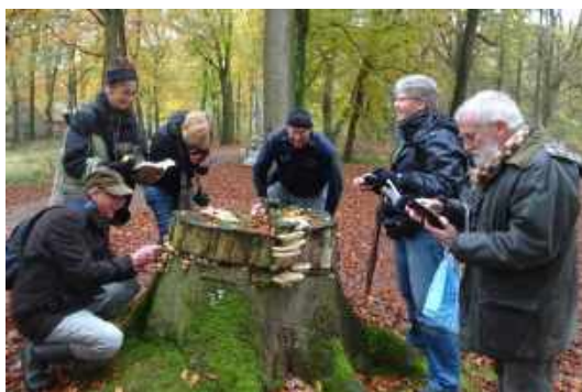
Excursie Gorp en Rovert