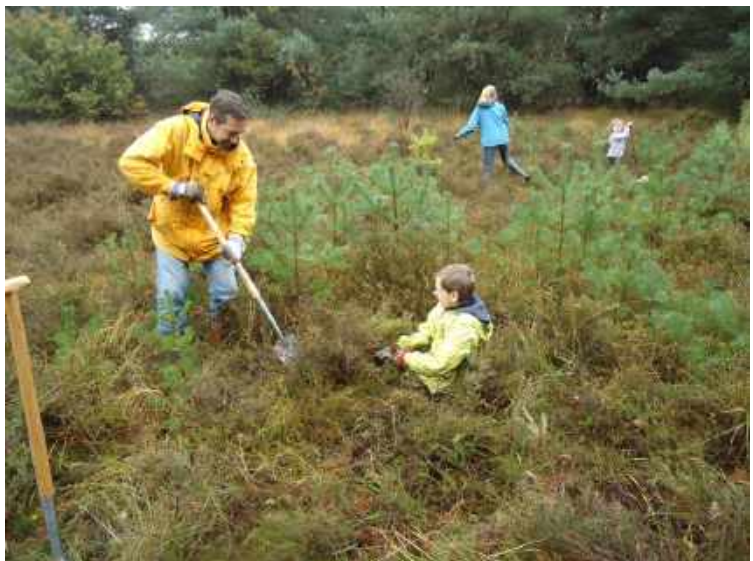
Samen aan het werk is 'quality time'

Details van de activiteit op 4 maart 2017 staan in de agenda. In verband met het regelen van gereedschap is vooraf aanmelden noodzakelijk via de email van de Plaggroep.