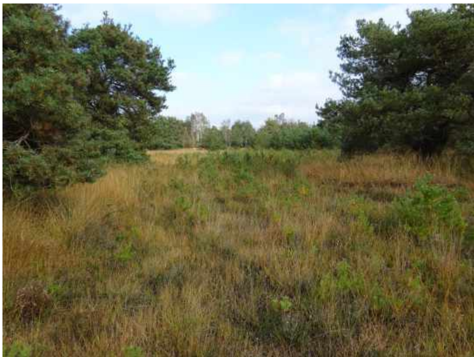
Mooie locatie in het overgangsbied van de open hei naar de bosrand

De locatie van 5 november 2016 ligt heel diep verscholen in een uitgebreid rustgebied van de Regte Heide. In de loop der jaren zijn diverse wandelpaden in het noordelijk deel afgesloten om de rust en stilte te bewaren. Het is dus, naast een stil gebied, ook een ontoegankelijk gebied. En juist daar gaan we een Natuurwerkdag organiseren. Ja, en de reden is dat het zo'n prachtig gebied is. Het is ook een hele uitdaging om de werkdag juist 'daar' te organiseren. Vraagstukken als, hoe komt de Keet op die plek, het materiaal voor de tenten, kunnen de hulpdiensten ons vinden bij calamiteiten, en 'last but not least', kunnen de deelnemers er ook komen? Die praktische zaken hebben we opgelost.