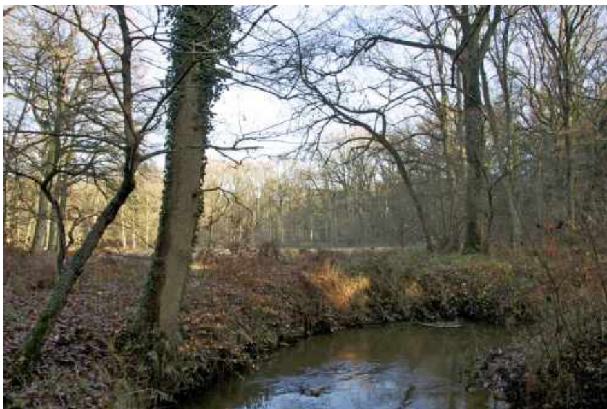
De Rovertsche Ley – een van de aardkundig waardevolle gebieden in de provincie. Deze beek loopt voor een gedeelte parallel met een geologische breuk in de bodem. Juist op dat gedeelte zijn in het verleden graslandjes aangelegd! Toeval?.