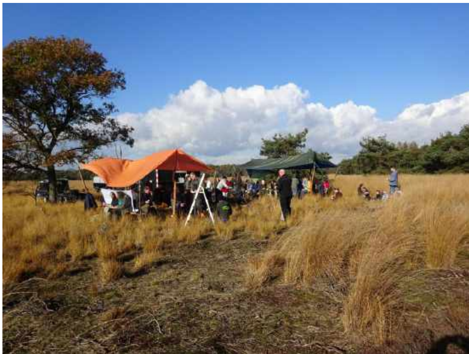
Prachtige locatie mooi weer en enthousiaste deelnemers

De deelnemers keren voldaan naar huis. We pakken de spullen weer in en geven het terrein weer terug aan de Reeën. We kunnen terugkijken op een prachtige dag, met mooi weer, unieke locatie, geen ongelukken en prachtige deelnemers.