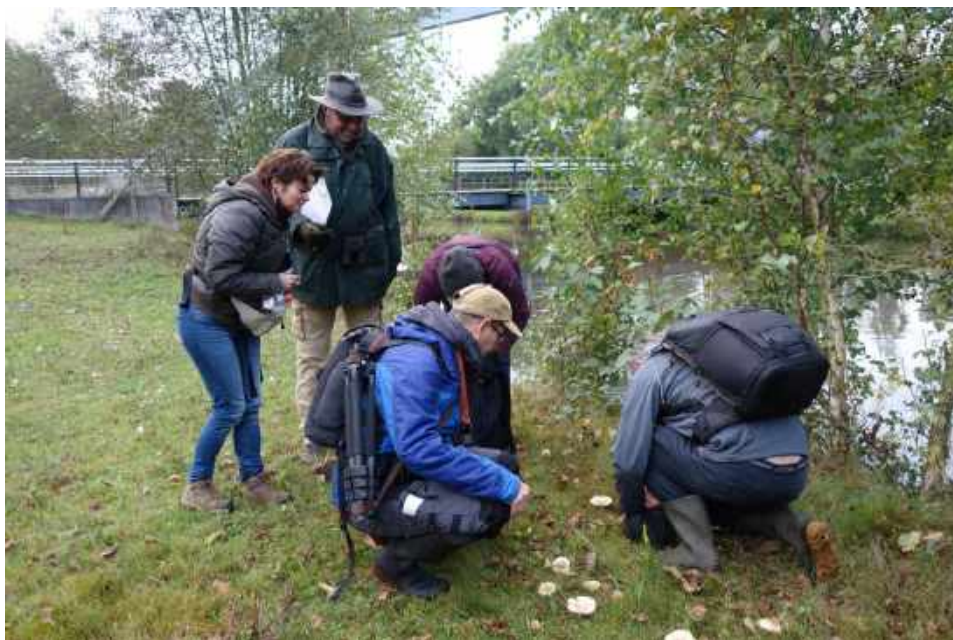
Paddenstoelenzoektocht Dongevallei