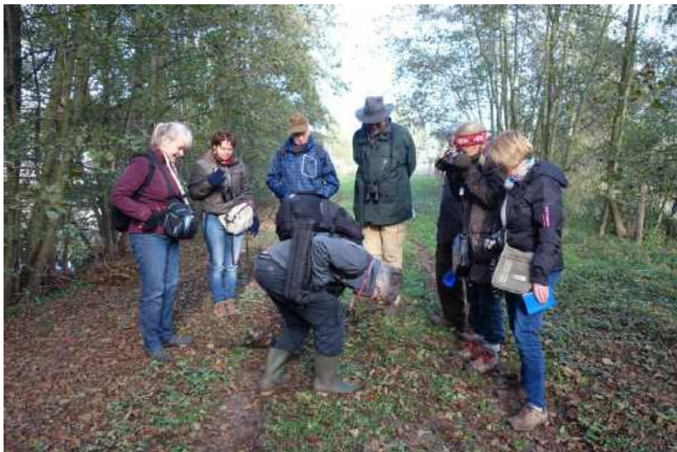
Paddenstoelen zoeken in de Dongevallei