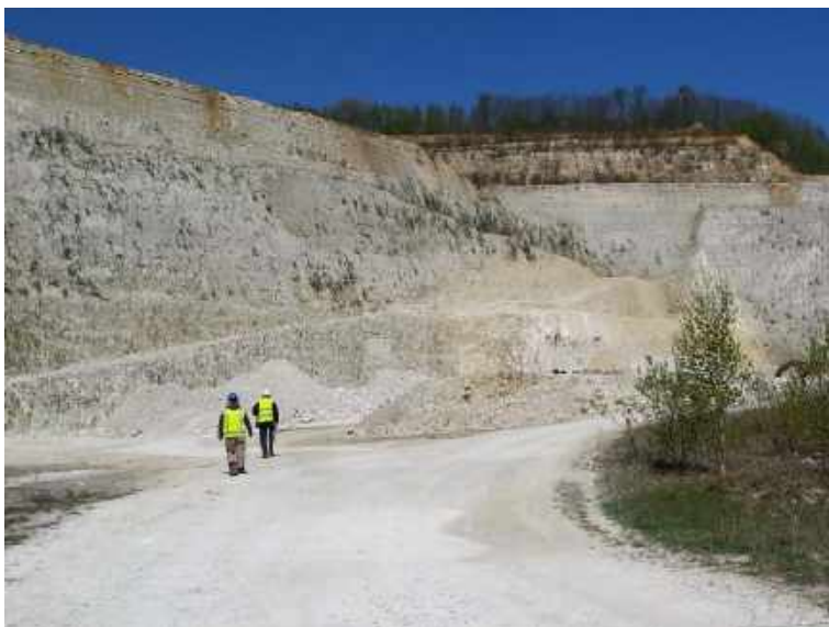
Krijtgroeve bij Haccourt