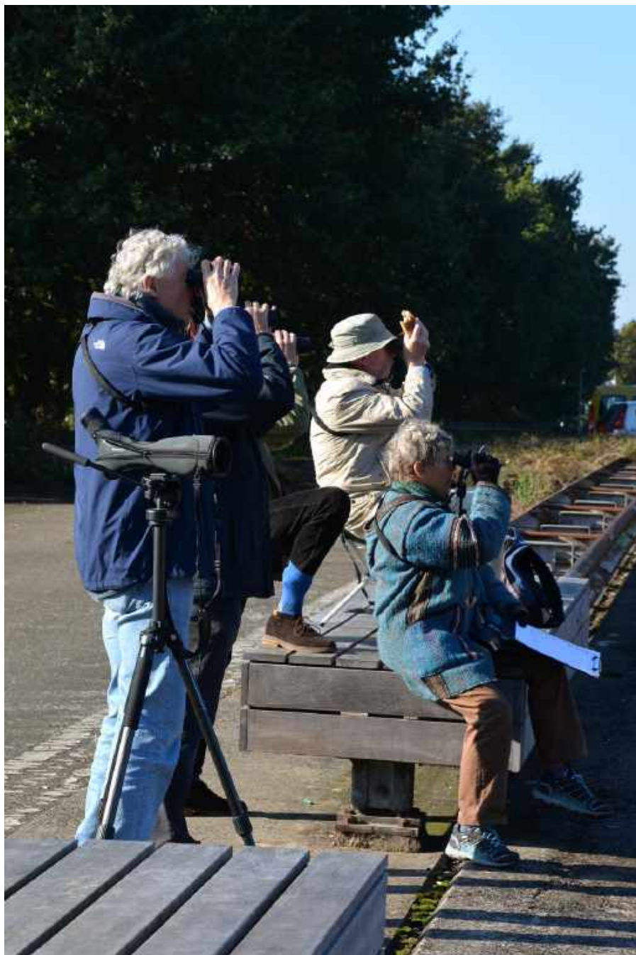
Hoor je hem of zie je hem