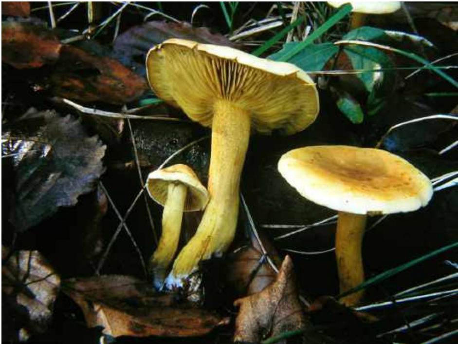
Narcisridderzwam (foto Ger Bogaers)

Maar dat de geur vaak moeilijk te omschrijven is, blijkt wel uit de tekst bij de zeer onaangename reuk van de Narcisridderzwam. Die ruikt naar carbid, naar lichtgas, naar verse teer, koolteer, acetyleen . Irma werd er tijdens een excursie wat onpasselijk van! Heb je al je zintuigen in werking gezet en met je boeken erbij kom je er nog niet uit, dan is het tijd om een microscoop met bijbehorende chemicaliën en vakliteratuur aan te schaffen. Maar dat is een flinke stap verder.