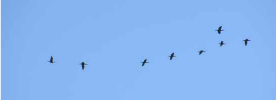
Groep langsvliegende Aalscholvers