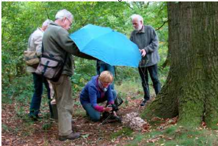
Toon was ook zeer behulpzaam

Hij was een van onze oudste leden: hij werd in 1951 lid van de KNNV, en al die 65 jaren was hij actief lid. Hij was betrokken bij de oprichting van de eerste vogelwerkgroep in 1953. Bij het in 1958 opgerichte Vogelringstation Tilburg was hij vanaf het begin betrokken bij de organisatie daarvan, ook toen vanaf 2005 het Vogeltrekstation als Vinkenbaan Kaaistoep verder ging. Hij verzorgde daarvan de administratie en schreef jaarlijks het jaarverslag. Behalve vogelaar had hij een gedegen kennis van paddenstoelen. Vanaf de oprichting van de paddenstoelenwerkgroep in 1992 hielp hij mee met de organisatie en verzorgde hij de vondstenlijsten van de tijdens de excursies gedane waarnemingen. Zijn laatste paddenstoelenwandeling was op 7 oktober, vijf dagen voor zijn overlijden, naar Esbeek. Daar werd bijgaande foto genomen waar hij het overtollige licht dimde voor de fotograaf. Zijn hele leven stond in het teken van de beleving van de natuur. Zijn sympathieke aanwezigheid, maar ook zijn grote kennis van vogels en paddenstoelen zullen we zeker missen. Ger Bogaers.