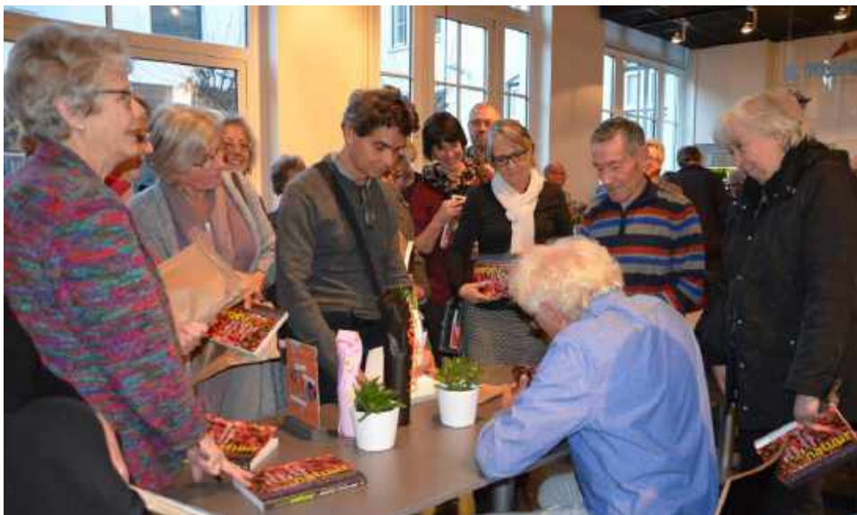
Na de boekpresentatie was er een drukke signeursessie