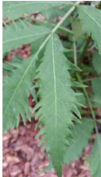
Detail van de plant