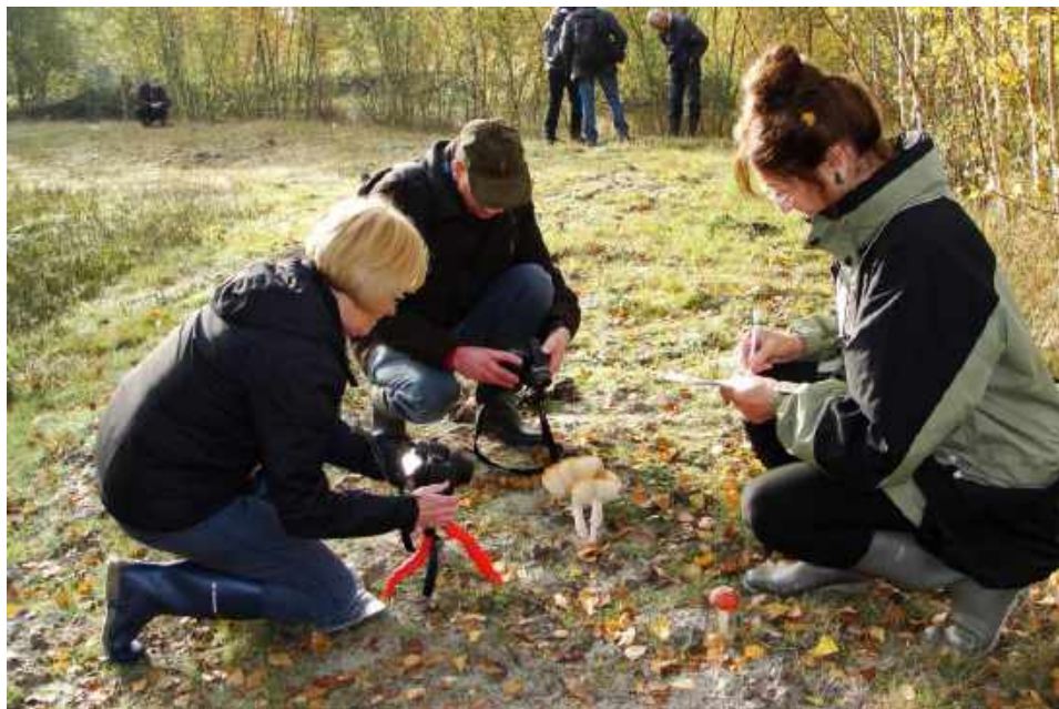
Veel paddenstoelen worden tijdens de excursies gefotografeerd