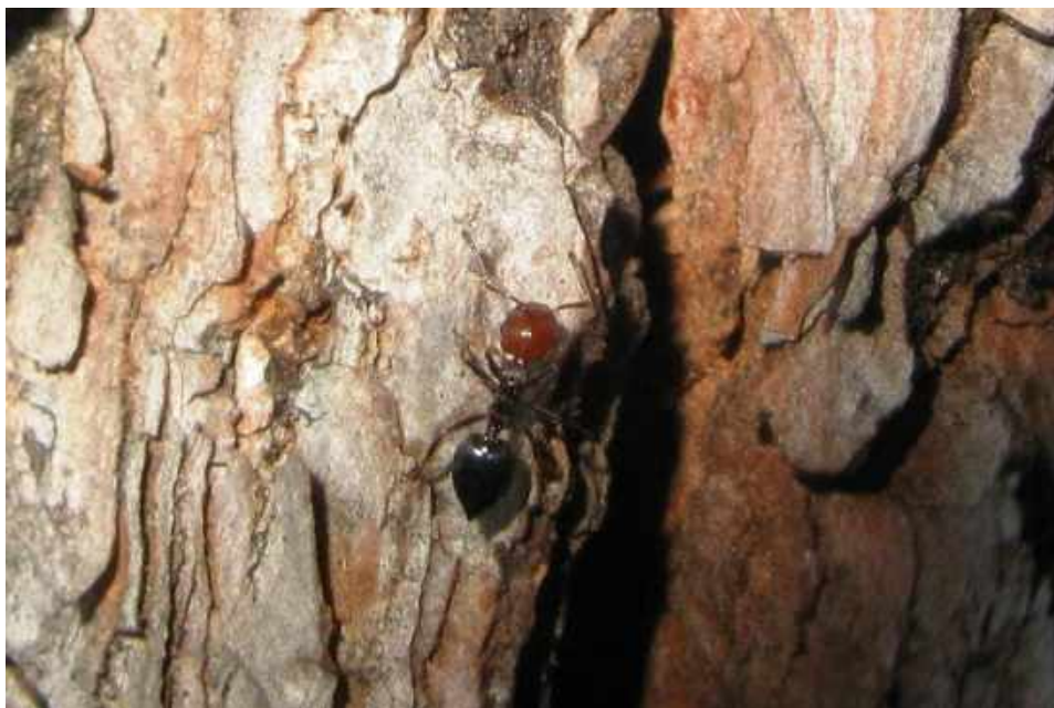
De rode koppen en spitse achterlijfjes van de Rode schorpioenmieren vallen direct op.

Nooit eerder in de periode 2002 tot en met 2014, tijdens 455 vangnachten waarbij 24.471 mieren werden gevangen, kwam het voor dat deze mier op het verlichte laken terecht kwam. Een unieke vangst dus. In De Kaaistoep moet een nest zitten. Als je namelijk acht exemplaren van één mierensoort vangt, dan moet er wel een nest in de buurt zijn, want alle mieren waarvan er acht of meer in één nacht in De Kaaistoep zijn gevangen, leven in De Kaaistoep.