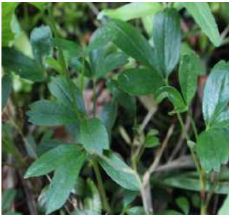
Driedelige blaadjes van de plant