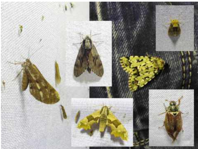
Grote variatie op het witte doek