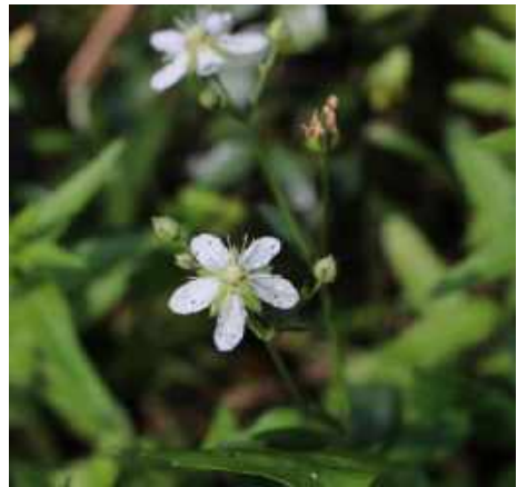
Witte bloemetje