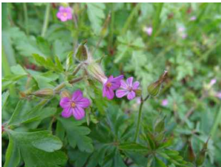
Klein robertskruid

Deze plant leek er sterk op maar de bloemen waren wat kleiner. Ik nam een enkel exemplaar mee en keek eens wat na op internet. Al snel kwam ik er achter dat dit Klein robertskruid moest zijn. Mijn waarneming werd diezelfde avond ook bevestigd met een goedgekeurd bericht van waarnemingen.nl. Enkele dagen later trof ik de plant op een andere locatie weer aan, ook in de buurt van de spoorlijn. Deze van oorsprong Mediterrane soort uit de Ooievaarsbekfamilie, is voor het eerst in 1986 in Nederland aangetroffen en breidt zich sindsdien via het Nederlandse spoorwegnet uit. De éénjarige plant, een exoot, bloeit van mei tot september en groeit op rotsachtige plaatsen, heggen, struwelen en langs spoorwegen. Verspreiding: Zeer zeldzaam in stedelijke gebieden. Deze soort staat op de Rode lijst 2012, thans niet bedreigd en stabiel of toegenomen. De bloemkroon van Klein robertskruid is kleiner dan 9 mm. Bij gewoon Robertskruid is die groter dan 9mm. Misschien zie je deze soort de komende tijd ook ergens langs het spoor; let vooral op de kleine bloemen. Hieronder mijn foto van Klein robertskruid. Een actueel verspreidingskaartje kun je vinden op www.verspreidingsatlas.nl .