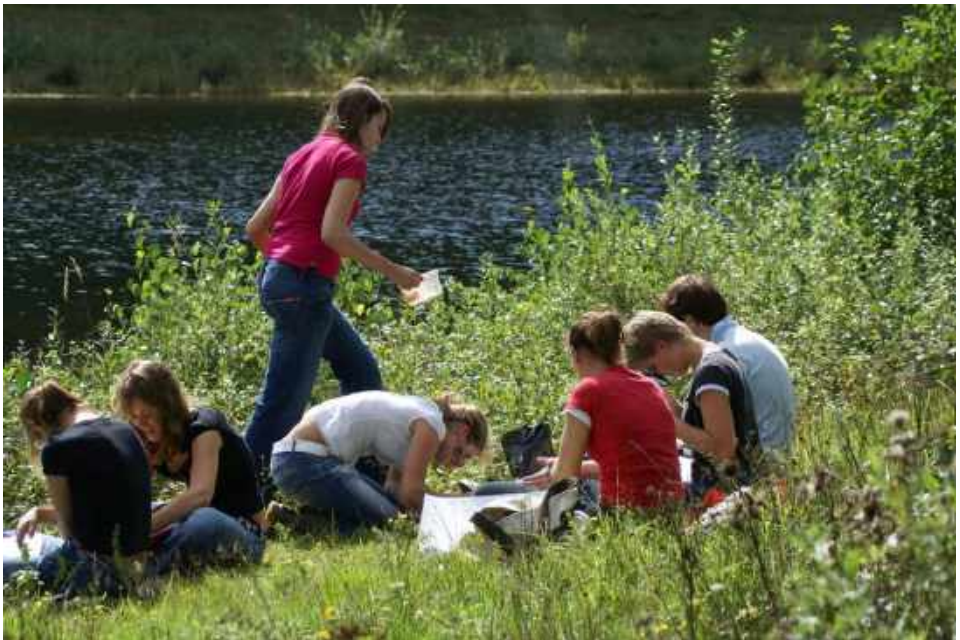
Gaan veldwerk en natuurwaarden goed samen