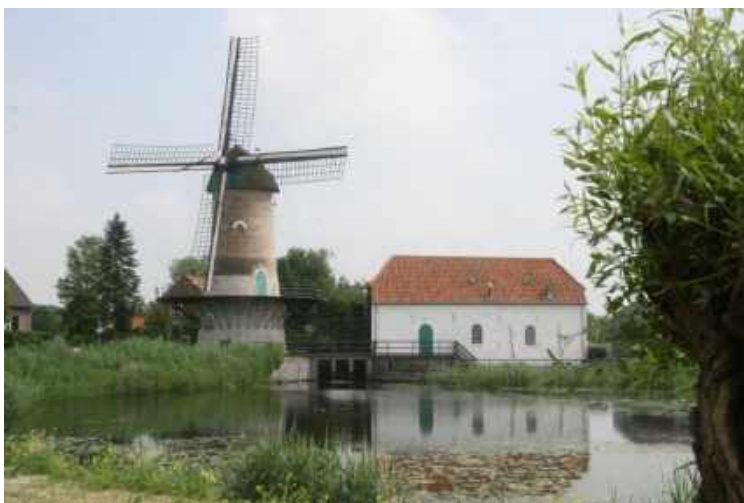
Kildonkse watermolen