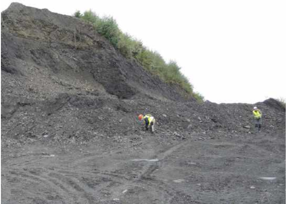
Fossielen zoeken in oude steenkoolmijn

Als je zin hebt om lekker met een hamertje en beitelje in het Limburgse land op (heel oude) stenen te tikken en wie weet een verrassende vondst te doen, kan zich aanmelden bij Geert Willemen (✉ g.willemen1@chello.nl ). Aanmelden kan tot 1 oktober a.s. Deelnemers krijgen per ommegaande nadere informatie.