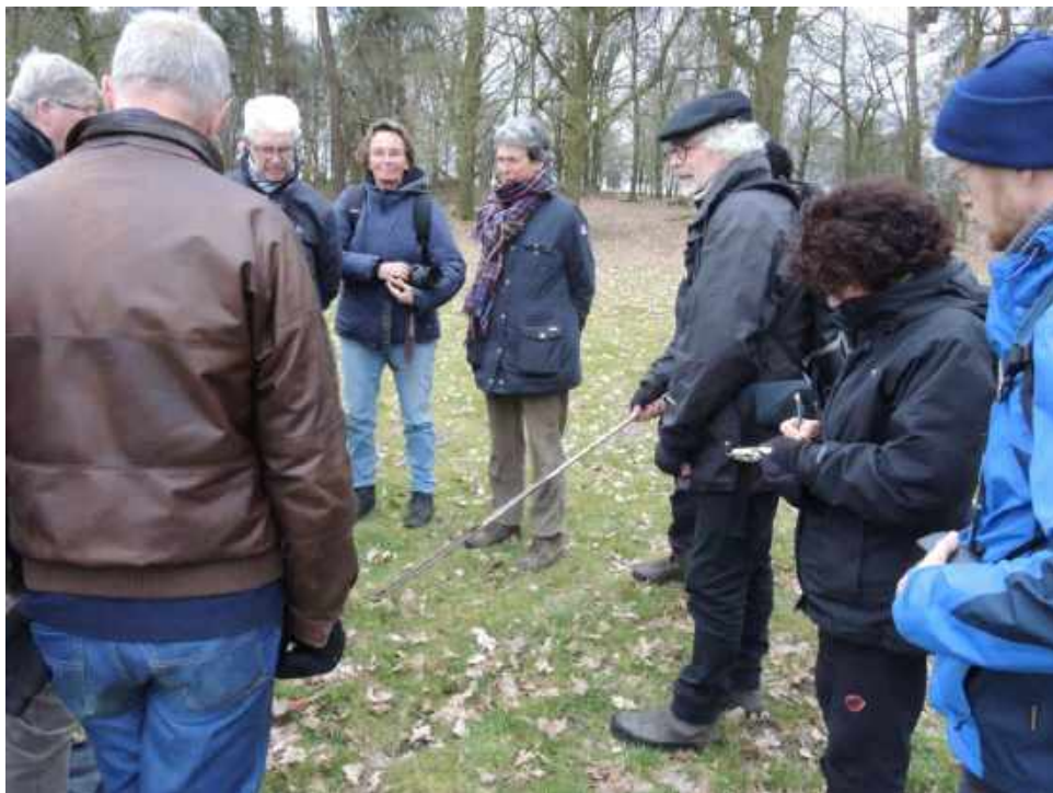
Grondmonsters werden bekeken