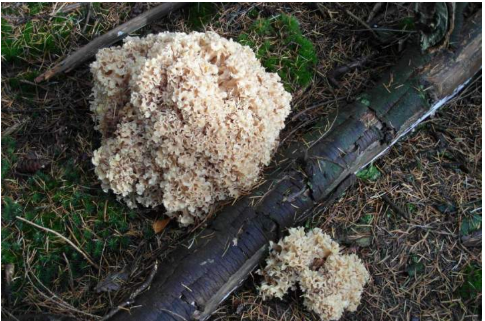
Grote sponszwam

De volgende dag, 27 oktober: een uitzinnig feest: de bevrijding van Tilburg. Paddenstoelendrama meteen vergeten. In 1945 werd ik lid van de Nederlandse Natuurhistorische Vereniging (toen nog niet Koninklijk) en ook daar was veel belangstelling voor paddenstoelen. Ik ondervond dat het veel sneller leerde om met "kenners" mee te gaan dan zelf je kennis vergaren uit een boekje. Naast paddenstoelen trokken de vogels vooral mijn aandacht. Ik werd lid van de in 1953 opgerichte vogelwerkgroep, waaruit in 1958 het Vogelringstation Tilburg ontstond. Precies 50 jaar maakte ik deel uit van deze groep en samen ringden we meer dan 250.000 vogels. Maar naast die vogels bleven de paddenstoelen mijn volle aandacht houden. Paddenstoelenexcursies waren altijd populair en de jaarlijkse openbare excursies in de Oude Warande trokken steeds heel veel belangstellenden. Uit een vaste groep enthousiaste paddenstoelenliefhebbers ontstond in 1992 de paddenstoelenwerkgroep, die nu nog steeds actief is met meer dan 20 leden. Het is dan ook een fascinerende hobby: Eén paddenstoel kun je plukken, bekijken, voelen, ruiken, proeven, doorsnijden, fotograferen, determineren en sommige soorten ten slotte ook nog opeten. En...er zijn meer dan 4000 soorten! Eindeloos.