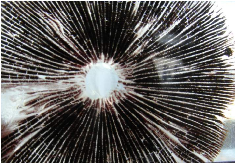
Sporen Franjehoed

In het verleden was ik drie maal medewerker bij een paddenstoelencursus in onze vereniging. De laatste keer is al weer 15 jaar geleden. Nu, voor de vierde keer komt er weer een korte paddenstoelencursus. Eén theorieavond, die ik zal verzorgen, gevolgd door een door je zelf te bepalen aantal excursies, onder deskundige leiding van leden van de paddenstoelenwerkgroep. Je hebt de keuze uit alle wandelingen van het excursieprogramma van de paddenstoelenwerkgroep, dat je ook in deze Oude Ley vindt. En je weet: met “kenners” meegaan leer je sneller dan uit een boekje. Had je al een zwak voor zwammen of was je nog op zoek naar een interessante hobby, meld je dan aan als deelnemer aan deze mini-cursus. Elders in deze Oude Ley vind je verdere gegevens voor deelname. Maar wees gewaarschuwd: eenmaal besmet met het virus, nee, met de sporen van de paddenstoelen, blijven ze je hele leven beïnvloeden. Je kijkt voortaan bij iedere wandeling met een andere blik naar die onbestemde zwammen. Ik weet dat uit ervaring. Maar heb je er toch zin in, dan graag tot ziens op de cursusavond.