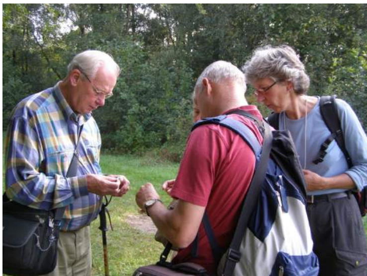
Paddenstoelen kennisoverdracht

De bruggen waren door de Duitsers al opgeblazen. In de bossen van de Rauwbraken (nu industrieterrein Loven) vonden we een flink assortiment, dat we thuis wilden determineren met behulp van een pas verworven paddenstoelenboekje. De hoeden van de paddenstoelen werden op een tafel uitgespreid op verduisteringspapier om er sporenfiguren van te maken, zoals we geleerd hadden bij de biologieclub van het Odulphuslyceum. Mijn ouderlijk huis was aan de Ringbaan Oost, dicht bij de spoorwegviaduct. Alle bewoners van de Ringbaan waren geëvacueerd wegens het oorlogsgeweld en ik sliep met mijn ouders elders in de stad bij familie, en daar ging ik weer naar toe. De volgende ochtend ging ik, benieuwd naar het resultaat, terug naar de Ringbaan Oost. De straat was afgesloten, maar via achterommetjes kwam ik toch in ons huis. Goed en wel daar volgde een enorme dreun. Het huis schudde en trilde. Ruiten vernield, deuren uit hun voegen en stuc plafonds kwamen naar beneden. Een enorme ravage. En de oorzaak: het spoorwegviaduct was opgeblazen. Onder het puin in mijn kamer lagen de paddenstoelen. Mijn eerste proeven mislukt door oorlogsgeweld.