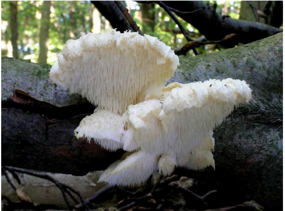
Gelobde pruikzwam

Brabant gepland, waar u als cursist aan deel kunt nemen. Zie hiervoor ook de informatie bij 'Paddenstoelenwerkgroep'. Aanmelden kan via de website www.knnv.nl/tilburg . Doe dat zo snel mogelijk, er kunnen maximaal 25 personen deelnemen aan deze cursus. Kosten voor KNNV-leden: € 5,- inclusief consumptie op 8 september. Niet-leden betalen € 25,- inclusief consumptie en een introductielidmaatschap 2016. Na uw inschrijving en betaling ontvangt u de bevestiging + excursieprogramma.