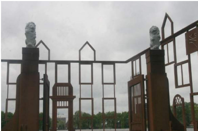
Contouren Huize Moerenburg

Kijk voor het volledige programma met de definitieve tijden en thema's van de wandelingen op 🌐 www.knnv.nl/tilburg . Begin september zal het volledige programma online staan.