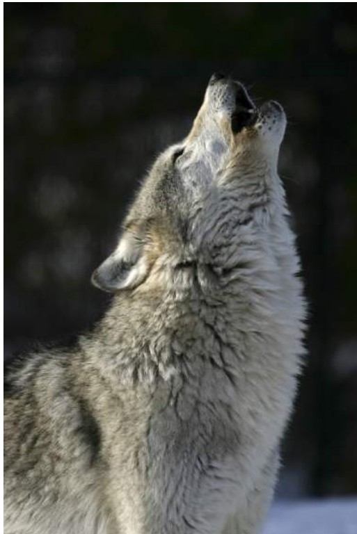
Wolf huilend

Hoe komt hij daar en waar komt hij vandaan? Is hij gevaarlijk? Wat betekent de wolf ecologisch gezien voor onze natuur, en kunnen we hem echt terug verwachten in ons land? Vanaf begin april waren er al vitrines met wolven, prooidieren en honden te zien op de eerste etage, tegenover het museumtheater. In de tussentijd werden er educatieve opdrachten ontwikkeld die half juni geplaatst zijn. Vanaf 19 juni is de tentoonstelling compleet. Wie de tentoonstelling doorloopt, leert de wolf beter kennen en kan na het bezoek een mening vormen over de terugkeer van de wolf: ja of nee? Verder kan de algemene wolvenkennis getest worden. Wat is er waar van alle spannende verhalen over de wolf? Stammen alle honden af van de wolf? En huilt een wolf echt naar de maan? Zelf aan de slag kan ook: uitrekenen hoe ver een wolf loopt of hoeveel vier kilo vlees is. Je kunt zelfs naar buiten lopen met een wolf tattoo op je arm! Voor de tentoonstelling werden de vitrines uit de zaal Overleven (De Reis) gebruikt, die op 2 maart werd gesloten. In deze zaal is nu Mystic Lights van Ronald Peeters te zien.