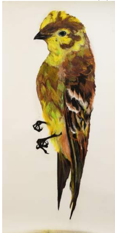
Yellowhammer van Roos Holleman

Een persoonlijke tour door het depot en het museum inspireerde haar tot een prachtige serie tekeningen, speciaal voor het museum. Tot en met 6 september is haar werk te bewonderen in de expositie Depotschatten , in de schaduw van het Potvis skelet. Roos Holleman tekent dode dieren, meestal vogels met pastelkrijt, niet zelden op zeer groot formaat. Met eenvoudige middelen weet ze een beeld neer te zetten met monumentale proporties. Het zijn niet zomaar nagetekende dode dieren: in de tekeningen van Roos Holleman krijgen ze een extra dimensie. Hoewel ze dood zijn, krijgen ze in hun representaties een ziel. Ze vormen een ode aan het levende dier, ze laten zijn schoonheid zien en roepen bewondering, verwondering en ontroering op. Het is die verwondering over de combinatie van schoonheid en vergankelijkheid waarin Natuurmuseum Brabant en de kunstenaar elkaar vinden.