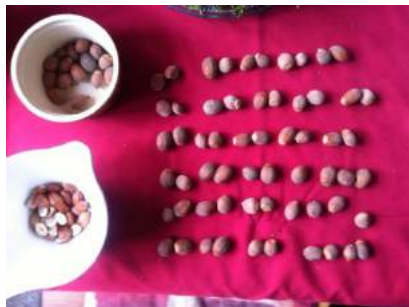
Hazelnoten pellen

Van de 75 noten dus 20 lege hazelnoten, dat is 26% van het totaal. Zijn vraag luidt: hoe kan dit? Is dit normaal bij hazelnoten? Was dit toeval? Was 2014 een slecht hazelnotenjaar? Is de standplaats van de hazelnoot bij Van Kooten slecht? Of is er een andere verklaring?