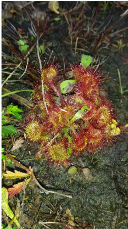
Ronde zonnedauw

En zijn er dan ook nog resultaten te melden? Natuurlijk, te veel om op te noemen. Daarom hebben we een informatie ochtend gepland op 4 juli (zie ook de agenda). Dus als je de resultaten met eigen ogen wilt zien, kom dan even langs.