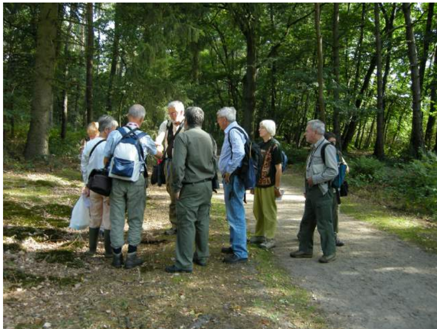
Samen op paddenstoelenjacht