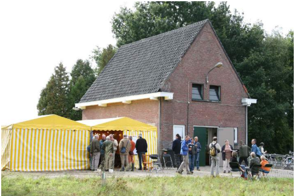
Net als met de soortendag in 2007 is het huisje en de tent onze uitvalbasis

Het evenement vindt plaats op het terrein van Rioolgemaal Moerenburg aan de Hoevense Kanaaldijk, Tilburg. De hele zaterdag 12 september gaan leden van de diverse werkgroepen van onze afdeling al op zoektocht door Moerenburg. Het is een afwisselend gebied, dat nog steeds volop in ontwikkeling is. Vijf jaar geleden hebben we tijdens de Dag van de Veldbiologie dit gebied ook uitgekamd. We zijn uiteraard heel benieuwd hoeveel soorten de hernieuwde zoektocht zal opleveren. Iedereen kan meedoen. De werkgroepen maken zelf een planning voor hun onderzoek, dus ben je speciaal geïnteresseerd in een bepaalde diergroep neem dan direct contact met de betreffende werkgroep op.