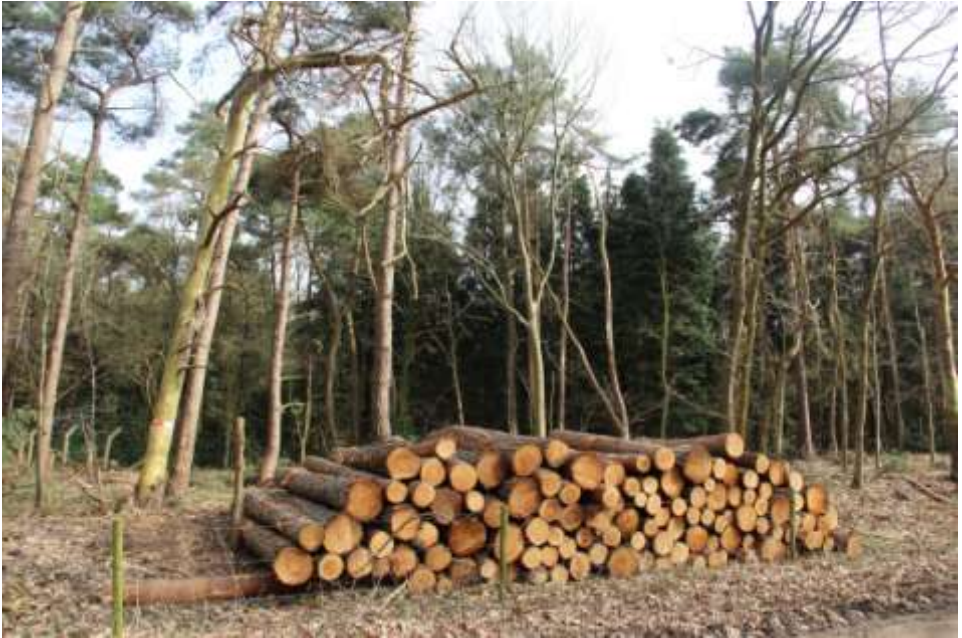
Door verkoop hout heeft terreinbeheerder wat meer financiële middelen.