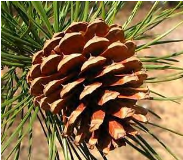
Pinus rigida

Het is de zogenaamde Doornden met de wetenschappelijke naam Pinus rigida . Deze kleine tot middelgrote boom is inheems in het noordoosten van de Verenigde Staten en komt volgens de verspreidingsatlas van Floron op zeven plaatsen in Nederland voor. De naalden van deze den staan in bundels van drie en zijn ongeveer 6-13 cm lang en vaak iets gedraaid. De kegels zijn 4-7 cm lang en ovaal met stekels op de schubben. Deze boom wordt in Amerika "Pitch pine" ofwel Pekden genoemd. Deze boom komt in verschillende biotopen voor: van droge zure zandige tot lage moerassige gronden. Hij kan in zeer slechte omstandigheden overleven. In het verleden werd het hout gebruikt in de scheepsbouw, woningbouw en voor bielzen vanwege de hoge hars inhoud. Vandaar dat de boom in Amerika "Pitch pine" ofwel Pekden wordt genoemd.