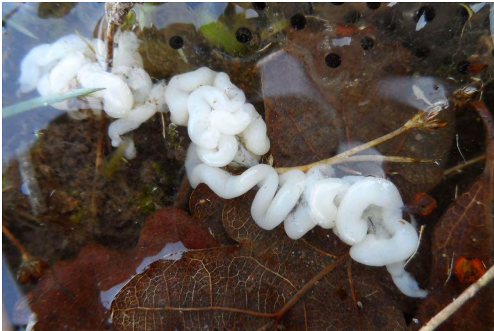
Witte kronkels

Jacques Smout liep tijdens een voorjaarswandeling eind maart langs de centrale vijver van Boswachterij Dorst. Er lagen verschillende klompen kikkerdril. Maar daarbij lag ook een witte sliertachtige en kronkelige massa. Volgens Jacques zou het zomaar een deel van de ingewanden van een pad of kikker kunnen zijn. Maar omdat hij niet zo goed vertrouwd is met de anatomie van reptielen en amfibieën, roept hij jullie hulp in om dit raadsel op te lossen.