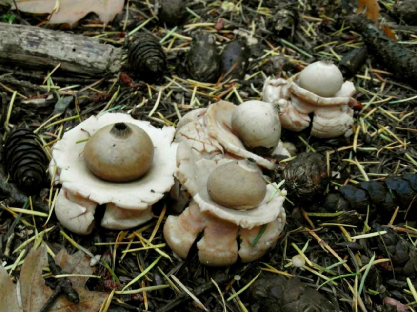
Gekraagde aardster