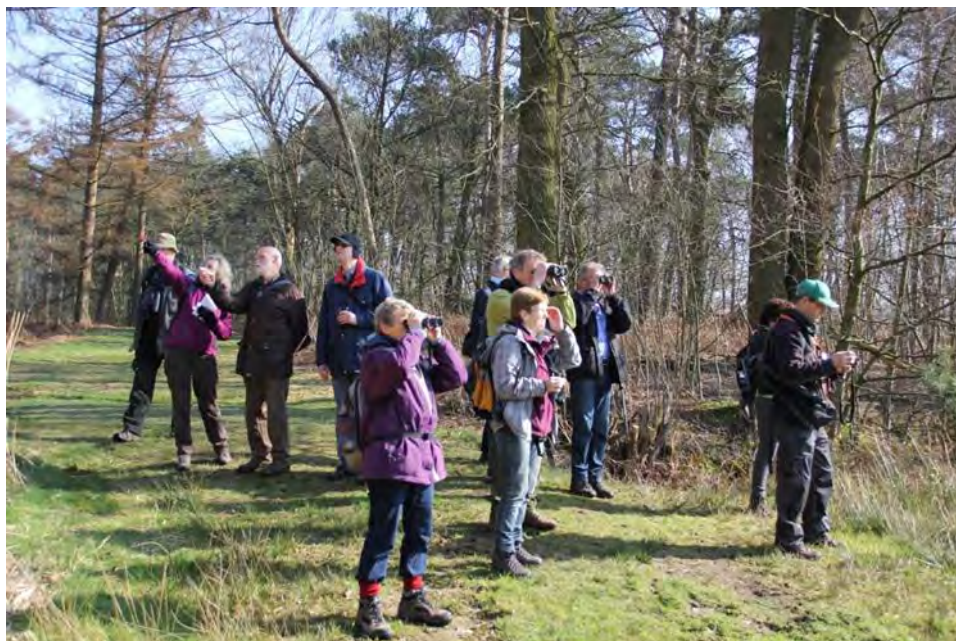
Groep bij het Mastbos

Bij het vertrek naar Breda was het nog behoorlijk mistig, maar de vooruitzichten waren gelukkig goed. Ons doel voor deze vrijdag de 14 e maart was het Mastbos en het dal van de Aa of Weerij. Vanaf café-restaurant De Boschwachter, gelegen bij de ingang van het Mastbos, gaan we met 15 personen op pad.