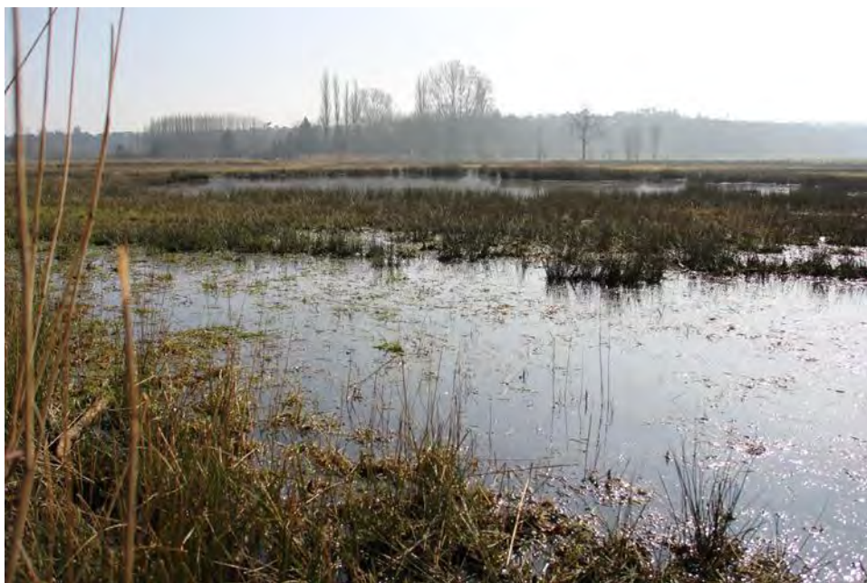
Dal van de Aa

We komen weer bij het Mastbos en lopen via dezelfde weg terug naar het vertrekpunt. Met een afzakkertje in de Boschwachter sluiten we weer een mooie vrijdagochtendwandeling af.