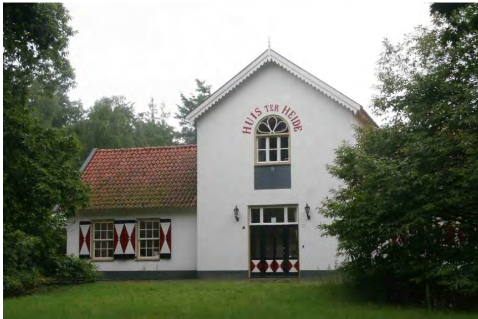
voormalige Beheerderswoning Huis ter Heide