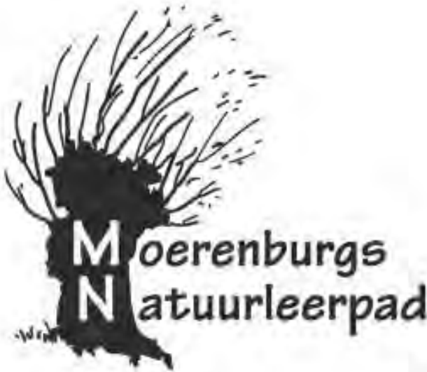
logo Moerenburgs Natuurleepad