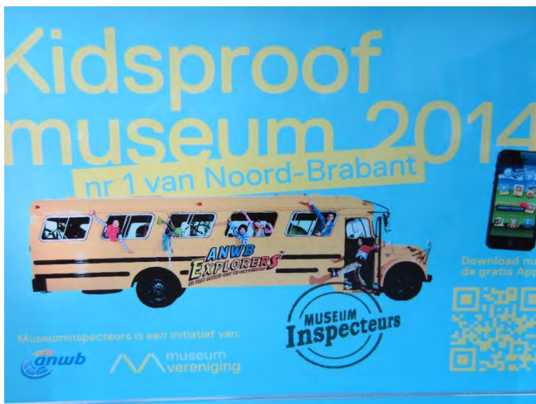
Kidsproof (foto Natuurmuseum Brabant).