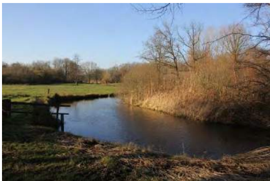
De (Oude) Nemer