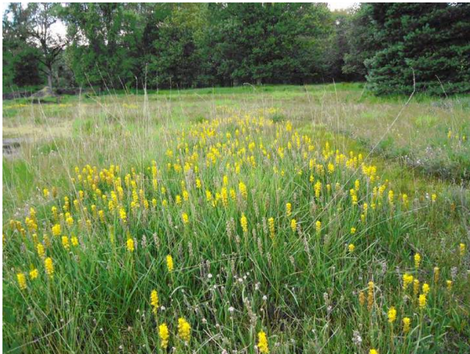
Beenbreek doet het enorm goed.

De werkzaamheden verschuiven langzaam naar meer beherende activiteiten. Mocht je geïnteresseerd zijn in de werkzaamheden van de plaggroep, dan kun je altijd een keer langskomen.