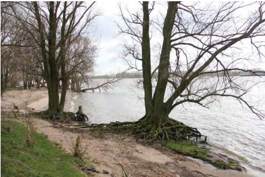
Merwede oever

Met een groep van 25 deelnemers rijden we op 22 februari jl. bij Werkendam de Biesbosch in en gaan richting Kop van 't Land. Overal zijn de werkzaamheden zichtbaar aan dijken en bruggenbouw, die het oude agrarische land zullen veranderen in een gebied waar het water in de toekomst meer ruimte moet krijgen. Even voor tieners steken we met de veerpont over naar het eiland van Dordrecht, waarna we links afslaan, de Nieuwe Merwede volgend, naar de Zuidhaven. Opvallend zijn hier nog de vele bunkers en kazematten van de verdedigingslinie uit 1940. Op de dijk maken we een korte stop om een grote groep Brandganzen te bekijken, die langs de Nieuwe Merwede foerageert.