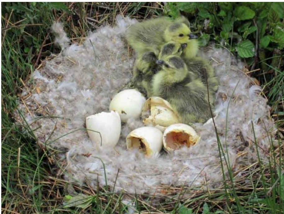
Nest met jonge Canadese ganzen

De bron kan ook erg gebiedsvreemd zijn (een luchtballon), slechts incidenteel voorkomen (waterscooter in stiltegebied) of juist een permanente karakter bezitten (drukke weg). Wanneer een broed- of foerageergebied dagelijks open staat voor recreatief gebruik, zijn de gevolgen van die verstoring groter dan wanneer een vogel zich bij een incidentele verstoring kan terugtrekken in een rustig gedeelte van het gebied.