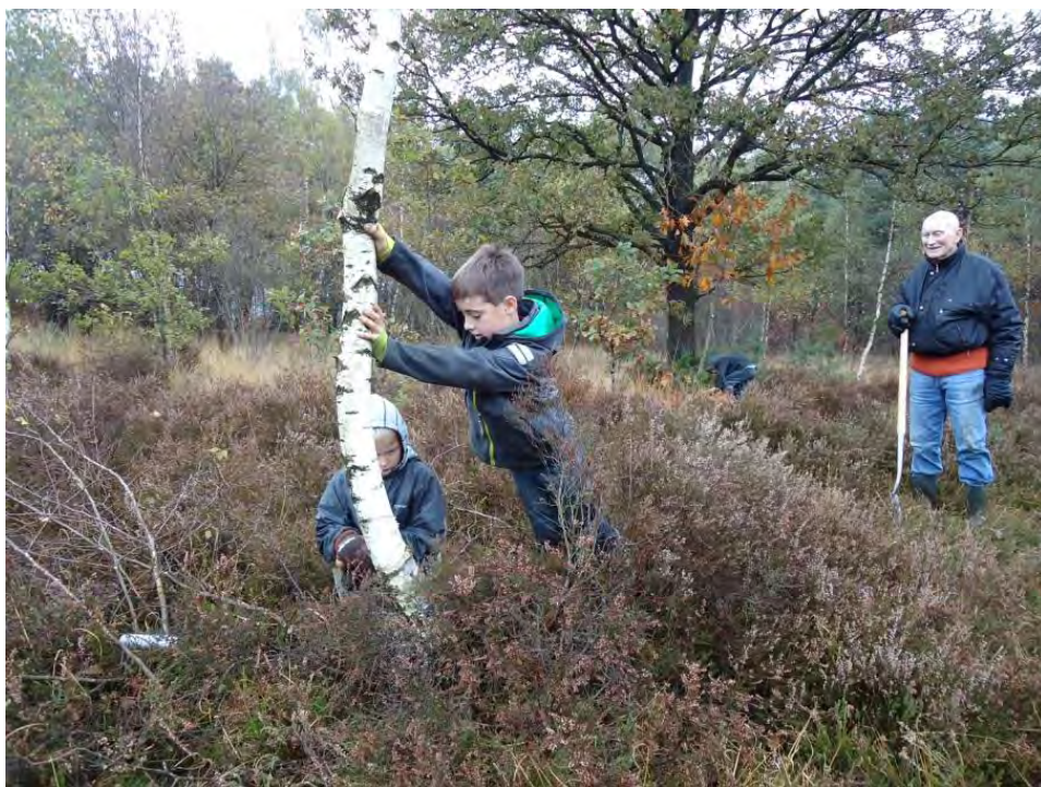
Jong en oud werkt hard tijdens de Natuurwerkdag

De landelijke Natuurwerkdag is een jaarlijks terugkerend evenement van natuurbeherende organisaties in Nederland, zoals Natuurmonumenten, Staatsbosbeheer en de 12 landschappen. Hierbij worden mensen in de gelegenheid gesteld om een dagje mee te komen werken in natuurgebieden. De vrijwillige landschapswerkgroepen leveren een werklocatie. Wij verzorgen, als KNNV werkgroep, al voor de 9e keer een werklocatie op de Regte Heide. Daarbij zorgen we voor een gevarieerd aanbod van werkzaamheden: er is werk voor kinderen, stoere mannen, en mensen op hoge leeftijd. De jongste was 6 jaar en de oudste 80. Natuurlijk is er een educatief aspect waarbij er uitleg wordt gegeven over het terrein en de reden van de uit te voeren werkzaamheden. Er zijn dit jaar 80 mensen bereid geweest om een hele dag lekker in de natuur te werken voor een kop koffie en een kommetje soep.