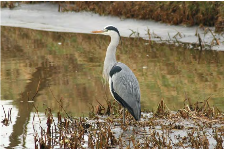
Reigerachtigen in open gebieden zijn gevoeliger voor verstoring

In effectstudies stelt men dat het meestal niet per sé relevant is of een individuele vogel verstoord wordt, maar of de kwaliteit van het leefgebied (habitatkwaliteit) afneemt door de verstoring. Volgens het eerder genoemde rapport is het een veel voorkomende denkfout dat alleen naar de (maximale) verstoringsafstand wordt gekeken en dat daarmee impliciet wordt aangenomen dat het gehele gebied ongeschikt leefgebied wordt. De vraag die gesteld moet worden is: betreft de verstoring een aantasting van de habitat of enkel van individuele vogels. Is er sprake van eenmalige of periodiek herhaalde verstoring? De intensiteit en duur van de verstoring is belangrijk. Is deze ingrijpend van aard bij een duurzame aantasting en/of permanente verstoring of is spoedig herstel van de 'verstoorde natuurwaarde' te verwachten? Op welke levensverrichting heeft de verstoring de meeste impact: het stressniveau van de individuele vogel (hartslag, hormoonspiegel, energiebalans, ed.) of het foeragegedrag, de predatiekans, broed- en reproductiesucces, populatie-ontwikkeling en overlevingskansen van vogels.