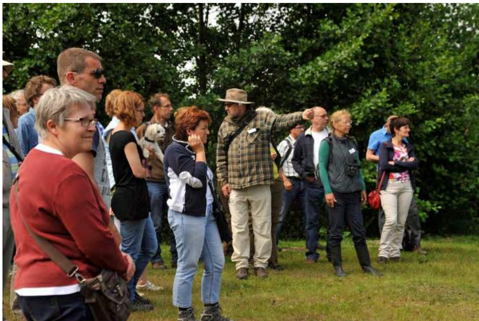
Goed geïnstrueerde gidsen met kennis van het gebied kunnen de verstoring beperken.

Voorgaande in beschouwing genomen, kom ik tot de conclusie dat de excursies die vorig jaar onder verantwoordelijkheid van de KNNV op 16 juni in de Dongevallei zijn gehouden aan alle genoemde voorwaarden hebben voldaan. Mijn inschatting is dat er op geen enkele wijze sprake is geweest van ernstige verontrusting van vogels en/of blijvende aantasting van de habitat. De excursies werden gehouden in een zeer beperkt gedeelte van het natuurgebied dat in de stedelijke sfeer is gelegen en waarvoor de eigenaar/beheerder toestemming had verleend. De excursies stond onder leiding van geïnstrueerde gidsen: de excursieduur beliep gemiddeld ongeveer 1 uur en de maximale groepsgrootte was ca.25 personen.