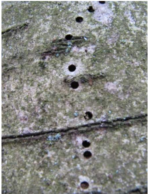
Gaatjes Berkenspintkever

getoond. De mooie gaatjes in een verticale rij op berk zijn inderdaad de “vinger-afdrukken” van Scolytus ratzeburgii (Grote berkenspintkever). Het beestje is lid van de snuitkeverfamilie ( Curculionidae ) en behoort tot de onderfamilie bastkevers ( Scolytinae ). Het boort in het spinhout van berken, vooral Ruwe berk, en de gaten die je op de foto ziet zijn “luchtgaten” die zeer karakteristiek zijn voor juist deze kever. De gaatjes zijn ongeveer 2 à 3 mm in doorsnee. Dat komt overeen met de doorsnee van de kever die een lengte heeft van 4 à 7 mm. Overigens: heel nauw verwant aan de Berkenspintkever is de Lepenspintkever ( Scolytus scolytus ), die de lepenziekte overbrengt.