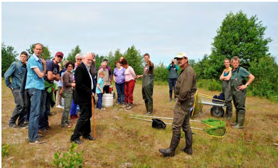
De soortendag in de Dongevallei leverde discussie op

Het voorjaar komt er weer aan! De broedvogels zoeken vanaf eind maart weer hun plekje in uw tuin, in openbare parken of in natuurgebieden. En daarmee wordt bovenstaande vraag ook weer actueel. Het vorig jaar ontstond binnen de vereniging discussie met betrekking tot de excursies die tijdens het 1313-soortenweekend in de Dongevallei werden georganiseerd. Ik heb toen beloofd hierover een artikel in de Oude Ley te schrijven. Belofte maakt schuld, dus ..... Om niet alleen mijn eigen mening te geven (die lijkt me voor iedereen wel duidelijk), heb ik getracht een zo objectief mogelijke afweging te maken door literatuur die hierover beschikbaar is te raadplegen en door professionele belangenorganisaties naar hun visie of beleid ter zake te bevragen. Dit heb ik gedaan door deze organisaties een kleine enquête toe te mailen over deze materie. De beschikbare ruimte in de Oude Ley is te beperkt om de enquête volledig weer te geven, maar deze is desgewenst wel digitaal bij mij beschikbaar.