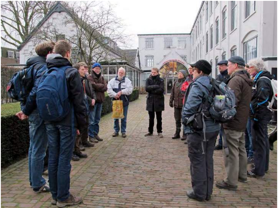
Doe Dag Korstmossen