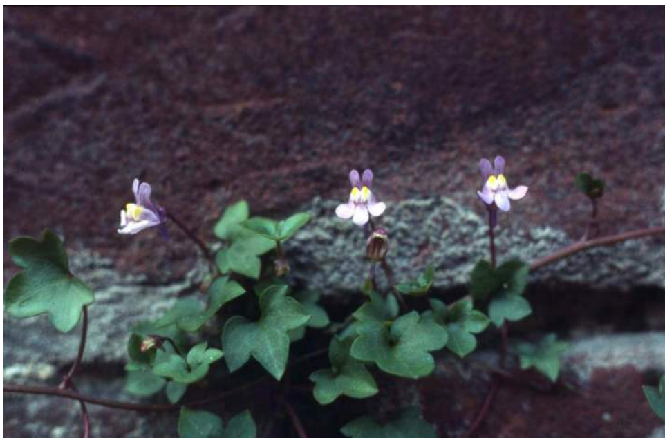
Muurleeuwenbek