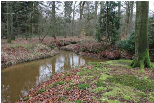
Driesprong, onder Beerze, boven Kleine Beerze, rechts Grote Beerze