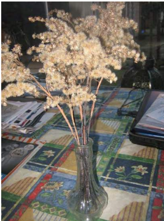
Uitgebloeide stengels

Iemand dacht dat het de Echte guldenroede was, maar dit is een zeldzame soort en niet kenmerkend voor braakliggende terreinen. Weet iemand welke plant het is. Mocht het de Echte guldenroede toch zijn, dan wil Varno natuurlijk graag weten of die meer op zulke plaatsen gevonden wordt.