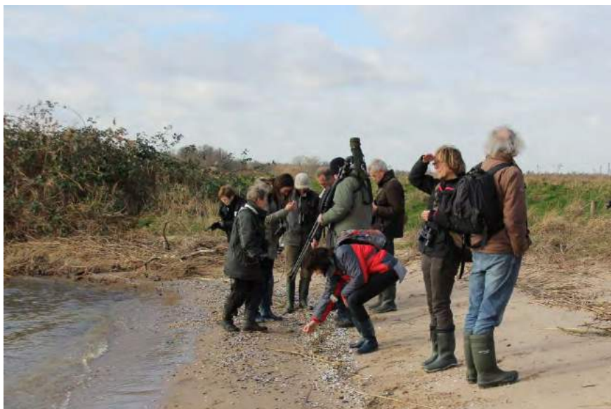
Schelpen op het strand.

De rivieroever is een schilderachtig plaatje met omgevallen en uitgespoelde wilgen. Op het strand vinden we de schelpen van de Toegeknepen korfmossel Corbicula fluminalis een exoot uit Azië. Vanaf de dijk kijken we in de polder Zuidplaatje (1839). Het weiland heeft hier nog veel reliëf. Op de hogere plaatsen zien we vele Madeliefjes bloeien. In de dijk bevindt zich nog een oud water inlaatwerk, waar vroeger water ingelaten werd voor slibbemesting. Met een windwatermolen werd het water, na bezinking, er weer uitgemalen. Wat verder weg tegen de oude eendenkooi zit een grote groep Kolganzen die ons aandachtig opneemt om dan op te vliegen. Dit geeft een mooi beeld van de vliegende ganzen in het volle zonlicht tegen het donkere bos van de eendenkooi. Langs de dijk vinden we een al bloeiende ereprijs die later door Huub Claesen gedetermineerd wordt als Grote ereprijs Veronica persica . Rond een uur zijn we weer terug bij de parkeerplaats en vertrekken we richting huis. Bij de Spieringpolder wordt nog een korte stop gemaakt om een paar zaagbekken en een Eidearend te bekijken. Langs de oever van de Merwede maken we nog een praatje met een rietsnijder die hier zijn kostje nog verdient. Volgens deze man wordt hier het langste riet, 5 à 6 meter, van Nederland geoogst. Het lijkt ons een zwaar beroep om de hele dag gebukt het Riet te moeten maaien. Wij wensen hem veel sterkte toe en vertrekken naar Tilburg.