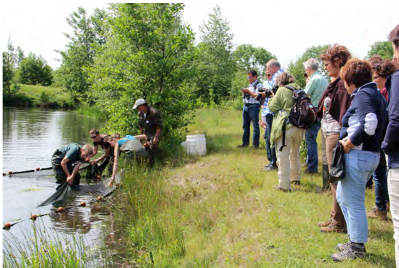
Met de zegen werd regelmatig gevist

De zondag trok gedurende de dag zo'n 170 geïnteresseerden. De excursies konden op veel belangstelling rekenen, waarbij velen verrast waren over de diversiteit. Het vossenhol en de Californische rivierkreeften waren voor vele bezoekers de highlights van de wandeling door het gebied. In het weekend zijn vier bezoekers lid van onze afdeling geworden.