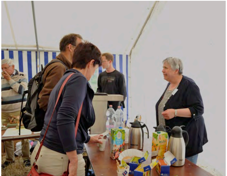
Ook voor koffie werd gezorgd