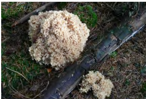
Koeienboleet en Grote sponszwam