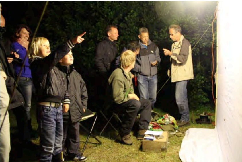
Veel belangstelling voor het witte doek

De publieksactiviteiten begonnen op de zaterdagavond om half elf. De 50 deelnemers aan de vleermuizen- en nachtvlinderexcursie zagen een aantal leuke nachtvlinders en vleermuizen, waaronder de Water-vleermuis, die vlak over het water foerageerde.