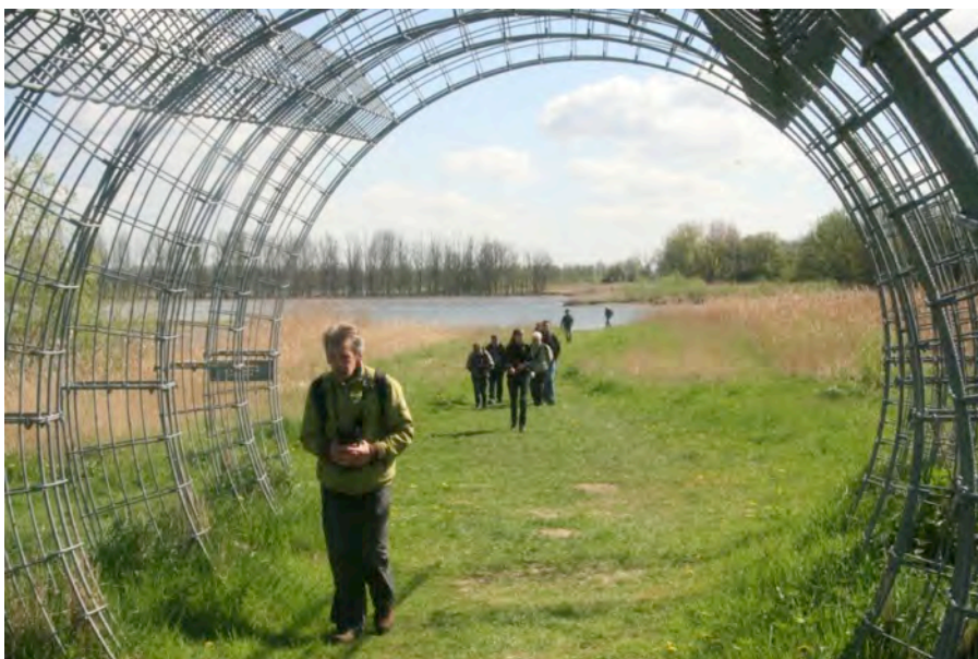
Excursiegangers duiken in de fuik

We blikken terug op een gezellige en zeker mooie vogelrijke, 69 soorten, dag.