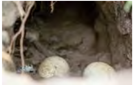
Ei in vossenhol