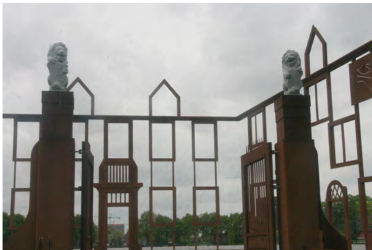
Contouren Huize Moerenburg.

contouren van dit kasteel weer zichtbaar gemaakt in het landschap. Het park grenst aan het beekdal van de Voortse stroom. Dit dal was jarenlang de vuilstortplaats van Tilburg. Een gedeelte van de stortplaats is gesaneerd tijdens de inrichting van het park. De Voortse stroom kan er nu weer vrij meanderen in het dal.