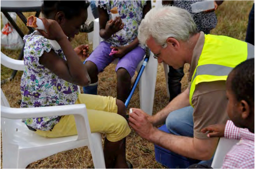
Corne moest als EHBO-er twee keer in actie komen