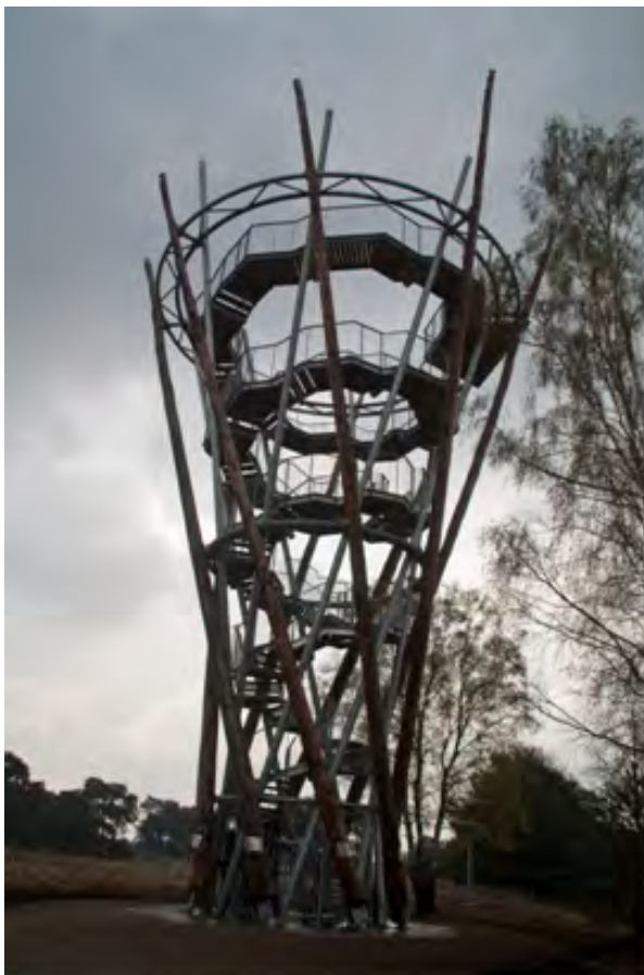
Uitkijktoren bij de Flaes.