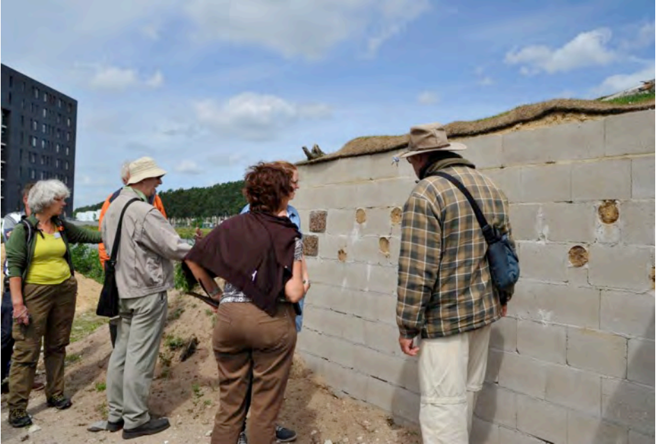
Tijdens de wandeling werd de oeverwaluwand bekeken

Tijdens het weekend is er veel werk verzet door de onderzoekers, excursieleiders en de ondersteuners inde tent en bij de activiteiten. Dankzij de medewerking van vele leden is het een geslaagd weekend geworden. We willen iedereen dan ook hartelijk danken voor hun inzet!