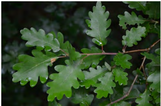
Bladeren van de Wintereik

seizoenen te maken heeft. Maar de mensen die beide bomen kenden, konden die relatie niet leggen. Onze vereniging telt genoeg bomenkenners, dus voor de winter arriveert, wil ik dit zomerprobleem opgelost hebben.