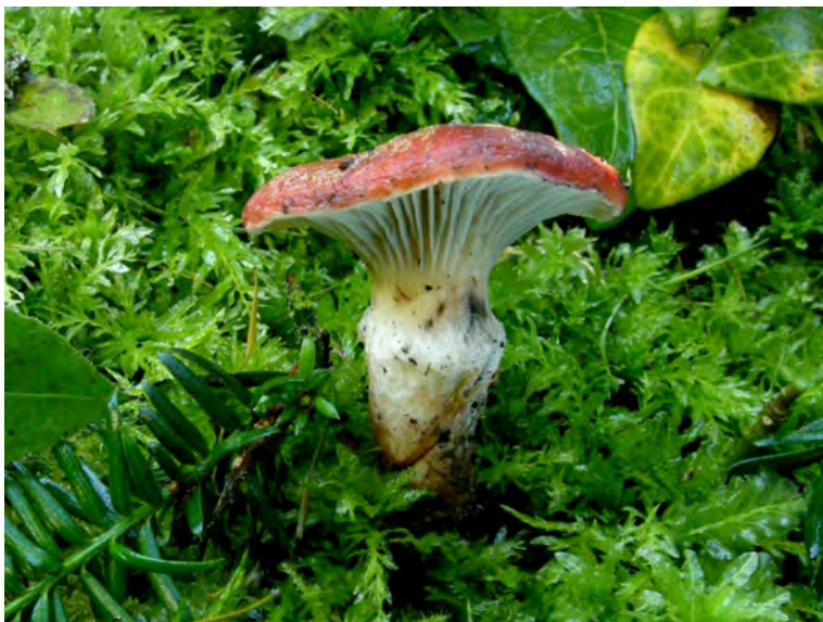
Roze spijkerzwam