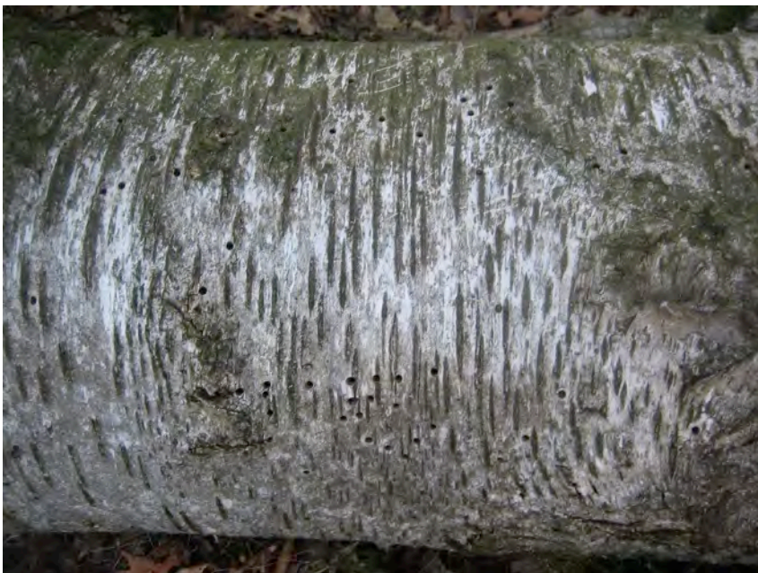
Ruwe berk met gaatjes

De vraag van Varno is natuurlijk: Wie of wat heeft deze gaatjes veroorzaakt? Kan het een boktor zijn of een ander insect?