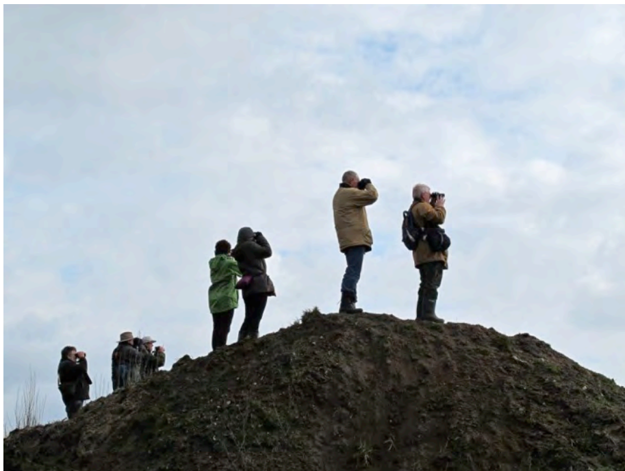
Vogels speuren vanaf de zandberg

De bedoeling was om op vrijdagmiddag 1 april een bezoek te brengen aan Den Opslag, maar omdat dit gebied zich niet goed leent voor een rondwandeling had onze begeleider gekozen voor het aan de overzijde van het Wilhelminakanaal gelegen Diessens Broek; eigenlijk heet het hier nog Houtakker Broek. Vanaf de kanaaldijk, net voorbij het punt waar het Spruitenstroompje onder het kanaal doorgaat, is er sinds kort een verbindingspaadje richting de waterzuiveringsinstallatie. De eerste waarneming die we doen is een Tapuit op doortrek. Vlakbij de waterzuivering ligt een grote berg grond afkomstig van de grootscheepse afgraving die de afgelopen jaren in het Broek heeft plaatsgevonden. Deze `berg` wordt door een aantal deelnemers bedwongen. Boven aangekomen hebben we een goed overzicht. In de nabije toekomst wordt de berg afgegraven want de grond is nodig om een dijkje aan te leggen rond de zuiveringsinstallatie. Het Diessens Broek is namelijk ook een opvanggebied in tijden van grote wateroverlast.