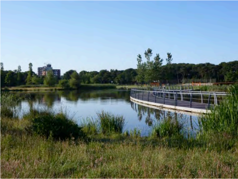
Drijvende brug foto