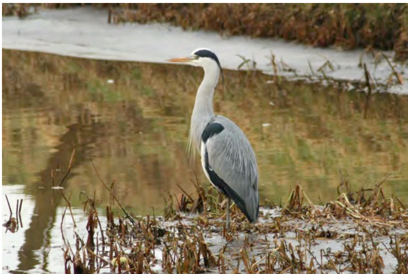
Blauwe reiger