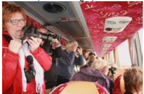
Vanuit de lekker warme bus wordt volop gevogeld en gefotografeerd.

Diverse Tureluurs, Wintertalingen, Wilde eenden, Wulpen, een Blauwe reiger, meerdere Watersnippen en zelfs twee Zwarte ruiters konden we goed zien voor het opvliegen.