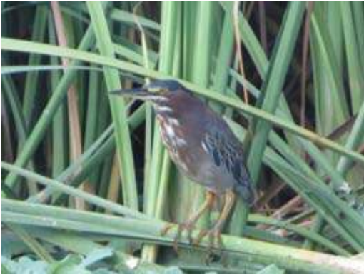
Groene reiger (Guido Stoker)