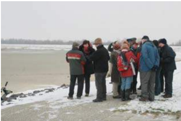
Koud hè (Ad Kolen)

Na een lange periode met hoge temperaturen en veel regen sloeg aan het einde van week 2 de winter toe. Gedurende de nacht en ook overdag kwam de temperatuur niet boven nul en op dinsdag en woensdag viel er veel sneeuw. Plaatselijk in het zuiden tot wel 15 cm. Het weer was aanvankelijk halfzwaar bewolkt, maar in de middag werd het lichter en aan het einde brak zelfs de zon door. Met een matige tot krachtige wind voelde het kouder aan dan het was: -3 tot -2 °C. Na het vertrek uit Tilburg bereikten we al snel het vestingstadje Willemstad. De wateren bij de oude stadsverdedigingswallen van Willemstad waren allemaal bedekt met ijs. Doordat de grote bus de draai naar de laan met leilinden niet kon maken, moesten we te voet naar de haven. Zoals verwacht was het de moeite waard. De koude en de harde wind had vele tientallen vogels de 'veilige' haven in gedreven. Van dichtbij zagen we Grote zaagbekken, Futen, Kuifeenden, Wilde eenden, Slobeenden, Meerkoeten, Waterhoentjes en Knobbelzwanen. Zo konden details zoals de grote lange slobbersnavels van de Slobeenden, de 'getande' bekken van de Grote zaagbekken en de kuiven van zowel de mannelijke als de vrouwelijke Kuifeenden goed gezien worden! Op de kop van de haven stond een ijzige wind, dus vlug terug naar de warme bus. Op de terugweg zagen we tientallen Huismussen in een dichte haag en Boomkruipers tegen de knotwilgen voor de Koepelkerk uit 1607.