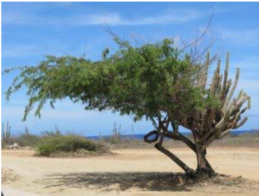
Cactus en Dividivi (Guido Stoker)

Een groot deel van de zuidoostkust wordt gedomineerd door min of meer aaneengesloten stadsbebouwing, toeristische hotels en industriële complexen. Hier en daar zijn nog wat resten van zoutmoerassen of laagtes waar hemelwater blijft staan. Een daarvan, de Bubali-moerassen, zijn ontstaan door het gebruik van de laagte als wastewater-basin om het afvalwater op biologische wijze te reinigen, voordat het op zee wordt geloosd. Langs de riviertjes aan de kust groeiden oorspronkelijk mariene mangrovebossen, maar deze zijn eigenlijk alleen nog maar bij Spanish Lagoon aardig ontwikkeld. Het noordoosten van het eiland kent overwegend een natuurlijke begroeiing, afgewisseld met wat marginale landbouw. Vroeger werd het eiland intensief geëxploiteerd door Aloë-boeren, maar door de komst van synthetische vervangers is deze teelt verleden tijd. Het meest heuvelachtige deel van de noordoostkust wordt ingenomen door het Arikok National Park. De vegetatie bestaat daar voornamelijk uit stekelige dwergstruiken, cactusbegroeiingen en verspreide Divi-Divi-bomen. De ruige kustzone is door de extreme windwerking en saltspray vrijwel kaal.