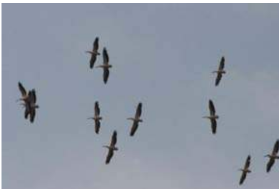
Vooral het zien van pelikanen tegen de strakblauwe lucht was een prachtig beeld (Ben Akkermans)

Er wordt geprobeerd om alle posten door twee mensen bezet te houden gedurende de gehele periode. Dit wordt gedaan door veelal veel vrijwilligers uit Nederland, Engeland en Bulgarije. Uit Bulgarije vooral door studenten. Deze hebben nog wat minder ervaring met vogels, maar het geeft ze wel vogelkennis mee in hun 'bagage' voor de toekomst. Er wordt ook gewerkt met een verplaatsbare radarinstallatie die langs de posten rouleert. Er wordt dan ook 's nachts geteld. Hoofdsoorten voor deze telling zijn: alle roofvogels, ooievaars, kraanvogels, pelikanen, bijeneters en oeverzwaluwen. Echter alle andere soorten worden ook meegenomen. De eerste dagen dat ik op de post was, samen met een Bulgaarse student, komt er een klein aantal Sperwers en Buizerds overgetrokken. Mooi waren de waarnemingen van enkele Bastaardarenden, Arendbuizerds en een paar maal een groepje Roze pelikanen.