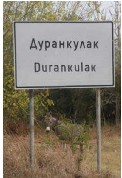
Op deze plek is er veel voor- en najaarstrek (Ben Akkermans)

Buizerds per dag. Dit jaar stond er overwegend een straffe oostelijke wind, zodat de relatief koude zeelucht van 20° C weinig aanleiding gaf voor thermiek. Verderop in het binnenland werden wel grote aantallen, van vooral roofvogels op trek, waargenomen. Een enkele post had op een dag zelfs 3700 Schreeuwarenden en honderden Buizerds waargenomen. Ook de ooievaarstrek moet begin september spectaculair zijn geweest. Er zijn dit jaar 45.000 Ooievaars op trek waargenomen in Bulgarije. Alleen al hier in Durankulak zijn er in enkele dagen 12.000 overgetrokken. Als migrators zien we wel iedere dag kleine en wat grotere groepen Vinken. Gemiddeld iedere dag 250 vogels. De laatste twee dagen waren het er meer dan 10.000 per dag. De trek van Spreeuwen varieert tussen de 800 en 1800 vogels per dag. De veldleeuwerikentrek is dit jaar beduidend minder. We zien er maar enige tientallen per dag. Een mooie waarneming was een Velduil die hoog opschreefde en dan weer verder naar het zuiden trok.