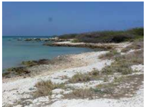
Ruige koraalkust

Aruba ligt in het zuidelijk deel van de Caribische Zee en is onderdeel van een eilandengroep voor de kust van het Zuid-Amerikaanse continent. Het eiland maakt dus geen onderdeel uit van de eilandenboog die loopt vanaf Florida via de Bahama's, Haïti, Puerto Rico en de Antillen naar het vaste land van Zuid-Amerika. Deze ligging heeft ook consequenties voor de vogelbevolking, waar ik later op terug kom. De kern van het eiland bestaat uit vulkanisch gesteente, waaromheen zich ooit koraalriffen hebben gevormd. Door tektonische bewegingen van de aarde zijn deze prehistorische, versteende koralen boven de zeespiegel komen te liggen. Tussen de koraalriffen hebben zich dikke pakketten kalkhoudende laguneafzettingen kunnen vormen. De noord-oostkant van het eiland is rotsig en kent vele inhammen (boca's), waar de