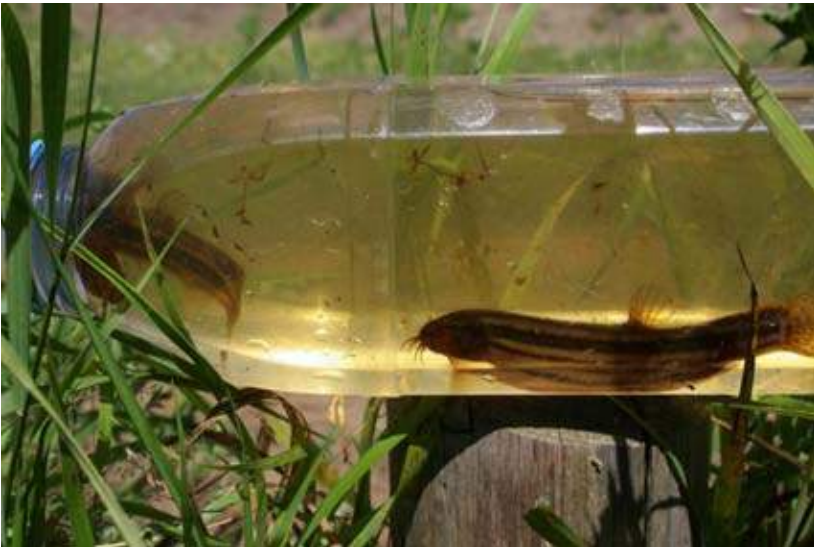
Grote modderkruipers in melkfles (Arnold van Rijsewijk)

Sinds 2010 beschikken we in Noord-Brabant over een prachtige, zeer informatieve vissenatlas (Brouwer et al. 2010), met daarin een schat aan viswaarnemingen die voor een groot deel door vrijwilligers zijn verzameld. Toch is over de verspreiding van vissoorten nog lang niet alles bekend. Daarbij gaat het vooral om kleinere, minder algemene soorten zoals bijvoorbeeld het BERPJE, de Riviergrondel, de Rivierdonderpad, de Bittervoorn, het Vetje en de Grote- en Kleine modderkruiper (zie foto's). Dankzij de verbeterde waterkwaliteit, aanleg van vispassages en herstel van habitats blijft de verspreiding van veel soorten positief veranderen. Echter door de groeiende populaties van exoten zijn er ook negatieve veranderingen. Kortom in de wateren in Tilburg en omgeving is nog veel te ontdekken.