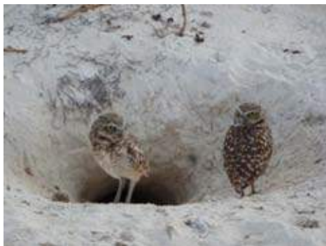
De Holenuiltjes waren gemakkelijk te benaderen (Guido Stooker)

Heb ik bijzondere waarnemingen gedaan? Ja, zelf vond ik de waarneming van een koppeltje Holenuiltjes nabij hun hol een bijzondere ervaring. Deze, broedt alleen op Aruba en er zijn nog maar 20-25 broedpaartjes. Het hol was op een vrij druk, vlak strand gelegen op nog geen 5 meter van de aanstormende golven. De vogels kon ik tot op ca. 2,5 meter benaderen! Verder zag ik langs de ruige noordkust een koppeltje Kuifcaracara's, meerdere keren een Visarend en ook Witstaartbuizerd, Smelleken en Amerikaanse torenvalk. Verschillende soorten die in de Fieldguide als uitermate zeldzaam worden beschreven, zijn door mij met zekerheid waargenomen. Dat waren ondermeer Chileense Kievit, Roerdomp, Kleine fuutkoet en de gewone Wilde eend. Van eerst genoemde soort heb ik verschillende keren meerdere exemplaren gezien, tezamen met veel Amerikaanse of Zwartnek-steltkluten, Kleine geelpootruiter, Kildeerplevier en de Bahamapijlstart. Een prima plek om elke dag even langs te gaan.