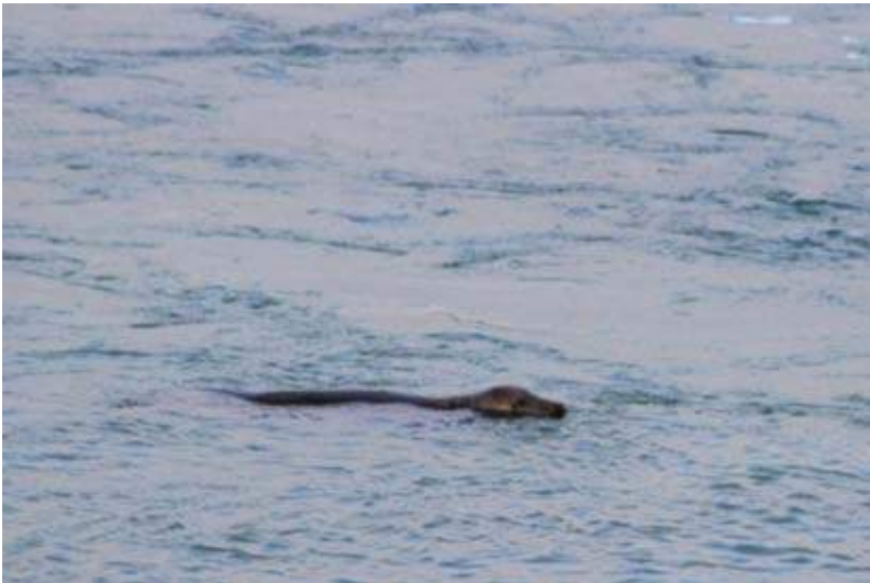
Zeehond in de in- en uitlaat in de Brouwersdam (Ad Kolen).

Na Zierikzee passeren we verschillende onderdelen van het 'Plan Tureluur'. Het is een natuurontwikkelingsplan op Schouwen om delen van het voormalige eiland terug in de staat van rond 1900 te brengen met laagtes en natte graslanden. In het eerste deel van dit plan, de Prunjepolder, ziet het er zeer ijsig en winters uit. Na een kleine groep Brandganzen zien we aan het einde van de weg, onder het naambordje van "Camping De Fazant", een prachtig gekleurde fazantenman zitten!! Daarna naar de Brouwersdam. Langs de Noordzee rijden we over de dam met onder andere een Roodkeelduiker, drie Geoorde futen, Steenlopers, Drieteenstrandlopers, Brilduikers, een Grote mantelmeeuw, Middelste zaagbekken, Rotganzen, Krakeenden, een vrouwtje Zwart zee-eend en drie zeehonden, waarvan tenminste twee Grijs zeehonden.