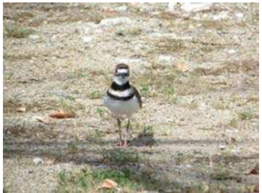
Kildeer plevier (Guido Stoker)