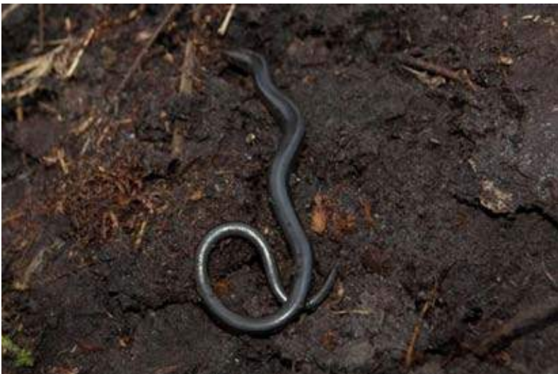
Jonge Hazelworm (Leo v Zeeland)